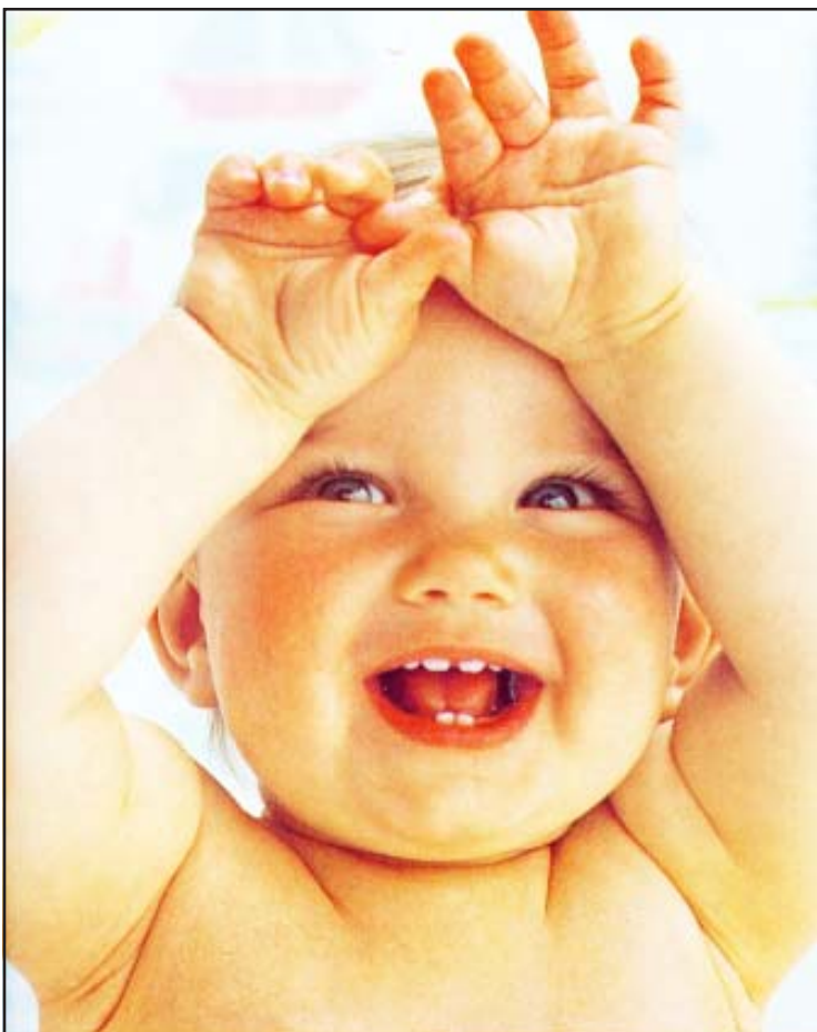
Siglo Veinte desea a todos sus lectores, anunciantes y amigos que en este año nuevo que comienza sea de prosperidad y salud en compañía de sus familiares.

Por su parte, los niños y niñas ya han comenzado a redactar sus cartitas a los Reyes Magos con sus innumerables peticiones de juguetes que desean les regalen, cartitas que dejarán al pie de sus zapatos la noche anterior al día 6 de enero.