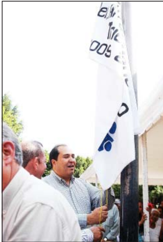
El gobernador Lázaro Cárdenas Batel, entregó en Tuzantla los certificados de estudios a cada una de las personas que vencieron el analfabetismo.

Asimismo, reconoció el apoyo que han dado los integrantes del Ministerio de Educación de la República de Cuba, quienes aplican el programa; los cuales se han dado la tarea de vencer el analfabetismo en la Entidad.