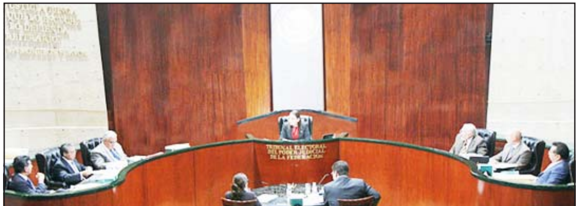
Sesión del Tribunal Electoral del Poder Judicial de la Federación.

AÑO XLI Huetamo, Mich., Domingo 30 de Diciembre de 2007. Núm. 2,659