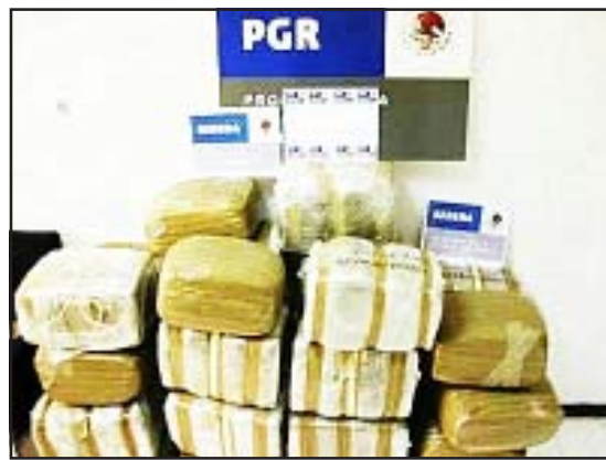
La marihuana encontrada dentro del automóvil.

Por otra parte, en el operativo de Prevención del Delito y Seguridad fue asegurado un vehículo con reporte de robo en la ciudad de Uruapan. El auto es marca Volkswagen tipo Jetta, modelo 1998, con placas de circulación PMR-2574, el cual fue desmantelado y abandonado en la jurisdicción municipal de Aguililla.