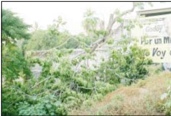
El pesado árbol cayó sobre su cuerpo.

Debido a las dos lesiones producidas al caerle una rama de un árbol, falleció una persona al medio día del martes pasado, cuando trabajaba cortando un árbol en las inmediaciones de la Avenida Madero Norte, colonia centro de esta