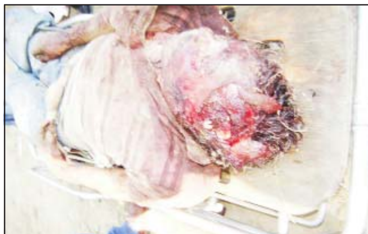
Después de dispararle un balazo en el cuello, pasaron sobre su cabeza las llantas de un vehículo cuando se encontraba sobre el suelo.

El infortunado falleció a consecuencia de una lesión producida por un impacto de proyectil de arma de fuego, que presentaba en el lado derecho del cuello, así mismo, el cadáver presentaba desprendimiento del cuero cabelludo, por lo que se presume