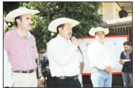
Teniendo a sus lados al presidente municipal de Carácuaro, Román Nava Ortiz y al diputado local, Antonio García Conejo, el gobernador Leonel Godoy Rangel, se comprometió a que durante su gobierno, mantendrá los programas de apoyo para los campesinos.

Agregó que buscará que los campesinos puedan acceder a créditos baratos, además de que puedan contar con asistencia técnica, y anunció que para el próximo año, existirá la posibilidad