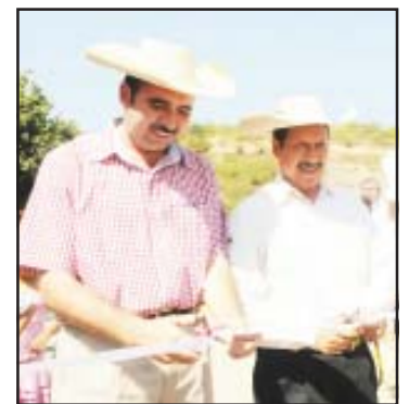
El gobernador Leonel Godoy y el presidente municipal de Carácuaro, Román Nava, cortaron el listón inaugural del andador al CECyTEM y ampliación de línea de energía eléctrica de la colonia Magisterial.

los grupos beneficiados en el diseño, instalación y manejo de huertos y abonos orgánicos; 20 pollos, de 3 a 4 semanas de edad; 9 metros de tela gallinera, y un microsistema de riego por goteo, entre otros.