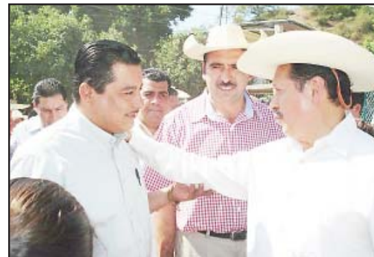
El gobernador Leonel Godoy Rangel, escuchó con atención los planteamientos que le hizo el presidente municipal de Nocupétaro, Francisco Villa Guerrero, sobre problemas y necesidades de los nocupetarenses, solicitándole su comprensión y apoyo a uno de los municipios más pobres del Estado.

Agregó que el programa se impulsa mediante la integración de paquetes de apoyo por beneficiario que incluye 17 especies de diferentes semillas de hortalizas, capacitación a