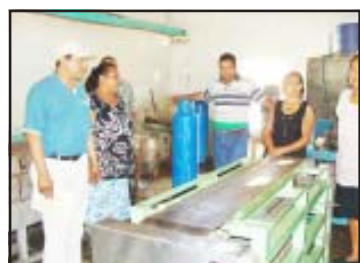
Un grupo de mujeres trabajadoras de la tenencia de Melchor Ocampo, perteneciente al municipio de Nocupétaro, recibieron de manos del presidente Francisco Villa Guerrero, un cheque por la cantidad de 55 mil pesos para la modernización de una tortillería, recursos provenientes del ayuntamiento en colaboración con el programa de Activos Productivos.

El alcalde Villa Guerrero, hizo un reconocimiento a Jaime Edén, titular de Desarrollo Rural Municipal, por el buen trabajo que está realizando ya que ha logrado gestionar buenos apoyos para el campo y para las pequeñas y micro empresas, en beneficio de todos los nocupetarenses, ya que juntos construimos soluciones, indicó Villa Guerrero.