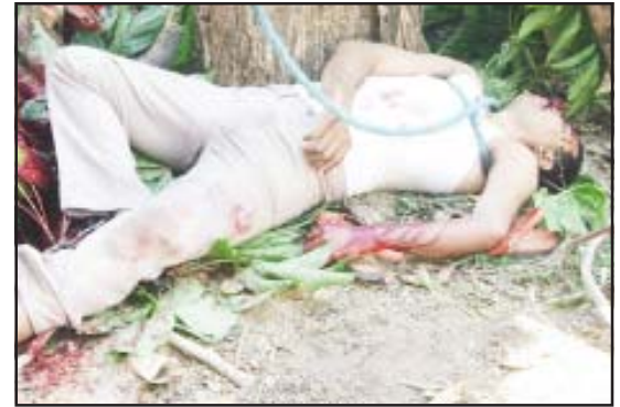
Sobre el suelo quedó el cuerpo sin vida.

consanguíneo había sufrido un accidente al caerle una rama de un árbol encima, por lo que inmediatamente se dirigió al domicilio donde se encontraba su hermano, y al llegar se percató de que éste ya había fallecido.