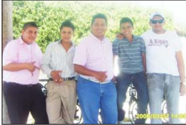
Chavos en el jardín de Cútzeo.

donde usted podrá estar informado desde cualquier parte del mundo del acontecer de nuestro Huetamo.