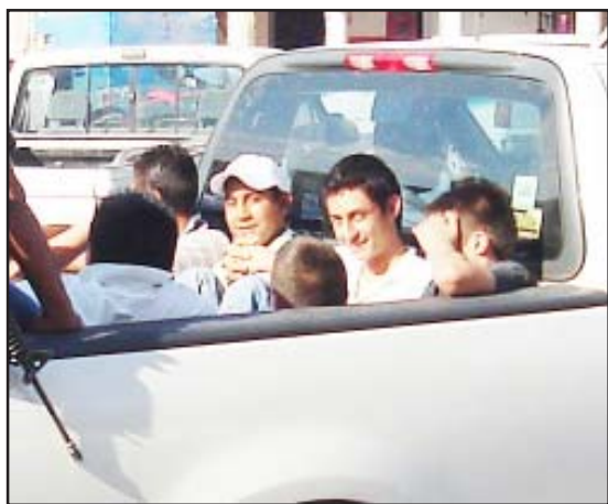
Los jovencitos fueron conducidos por la policía a la ciudad de Zitácuaro para su presentación ante la Agencia del Ministerio Público Especializada en Justicia Integral para Adolescentes.

menores mencionados, los cuales fueron trasladados a la ciudad de Zitácuaro para que respondieran ante la justicia por la violación en agravio de la menor.