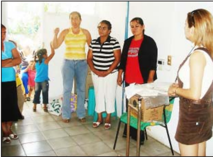
Momentos de la entrega de medicamentos en las instalaciones del Centro de Salud, por parte de damas integrantes del DIF municipal.

Cabe señalar que el monto recolectado fue de mil 200 pesos, interviniendo el DIF Municipal para obtener por medio de farmacias, los medicamentos a mitad de precio, que con esta acción la inversión rindió para más medicamentos que se pretende seguir suministrando al Sector Salud con más y mejores medicamentos, con siguientes acciones parecidas.