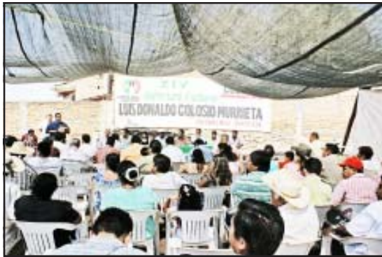
Representantes de los diferentes sectores del PRI de Huetamo, asistieron al acto luctuoso para recordar a Luis Donaldo Colosio Murrieta con motivo del XIV aniversario de su trágico fallecimiento.