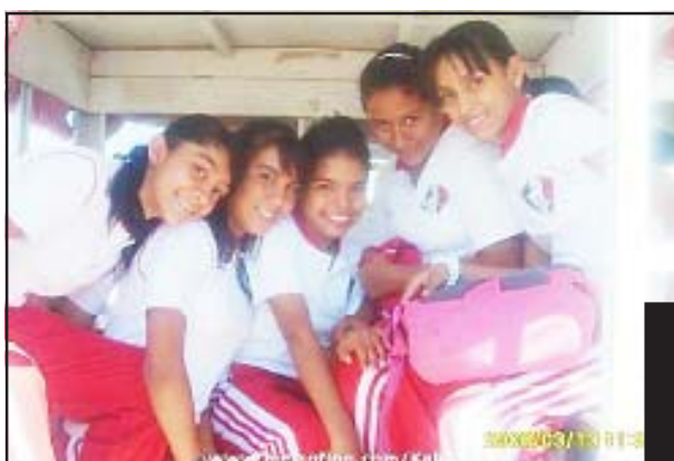
Amigas de la Secundaria No. 2.