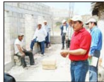
Para conocer el avance de construcción de dos aulas en la comunidad Loma Blanca, el presidente municipal de Nocupétaro, Francisco Villa Guerrero, supervisó las obras y designó un comité con padres de familia para la observancia de la construcción y la administración de los gastos requeridos.

de los jóvenes del municipio, ya que como profesor que soy sé que una de las inversiones más importantes es en la educación básica, subrayó Villa Guerrero, pues dijo que atacará fuertemente con recursos municipales solucionar los problemas educativos que prevalecen en las comunidades por la falta de espacios adecuados.