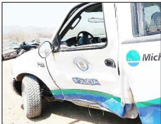
La camioneta de los delincuentes chocó contra la patrulla sobre uno de sus costados, después de haber recibido varios impactos al igual que otros vehículos policíacos que participaron en la persecución.

Sin embargo, en lugar de detener la marcha, los presuntos delincuentes abrieron fuego contra los uniformados, por lo que éstos repelieron la agresión y solicitaron refuerzos, llegando la unidad 037 al lugar de los hechos, los sospechosos intentaron darse a la fuga, iniciándose una persecución que terminó cuando la camioneta donde viajaban los sujetos y una patrulla, se estrellaron contra una barda.