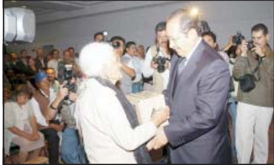
El gobernador Leonel Godoy Rangel, entregó personalmente los primeros paquetes de la Canasta Básica Alimentaria a personas de la tercera edad simbólicamente, de las más de un millón 400 mil que se habrán de repartir durante el presente año en todo el Estado en los 113 municipios michoacanos.