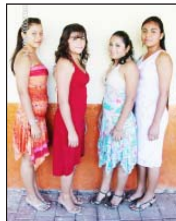
Este ramillete de bellas y encantadoras señoritas participaron en el concurso para elegir a la Reina de la Primavera, todas ellas alumnas de la Telesecundaria "Independencia de México".