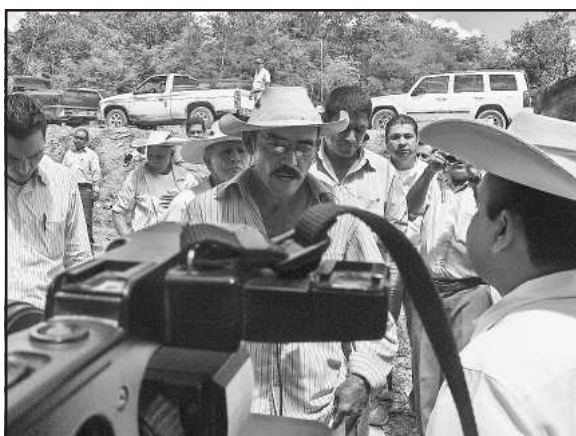
El funcionario, Fidel Calderón, escuchó los planteamientos de las necesidades que le formularon los huetamenses durante su gira de trabajo por el municipio, así mismo, conoció los avances de construcción de las obras en proceso que el ayuntamiento lleva a cabo en diferentes puntos del municipio.

Por su parte, el presidente municipal, Roberto García Sierra, pidió el secretario de Gobierno, Fidel Calderón, le hiciera llegar al Gobernador Leonel Godoy Rangel, el agradecimiento del pueblo de Huetamo por todo el apoyo que les ha brindado. Asimismo el funcionario estatal al dirigirles su mensaje dijo que el alcalde está trabajando y lo está haciendo bien en las obras más sentidas de la población en franca y estrecha coordinación con el Gobernador Leonel Godoy, quien aseguró, seguirá apoyando a las autoridades municipales hasta el último día de su mandato.