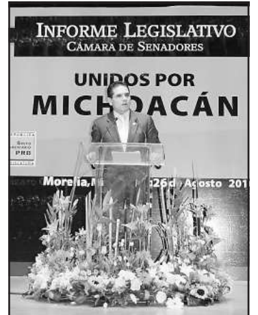
Ante más de 2 mil personas, el Senador de la República, Silvano Aureoles Conejo, rindió su informe de actividades legislativas ante la sociedad michoacana en la ciudad de Morelia.

El nativo de Carácuaro, Silvano Aureoles, vicecoordinador de la fracción parlamentaria del PRD en el Senado de la República y actual presidente de la Comisión Permanente del Congreso de la Unión, ha presentado 83 iniciativas en la máxima tribuna nacional, 162 puntos de acuerdo y ha participado 117