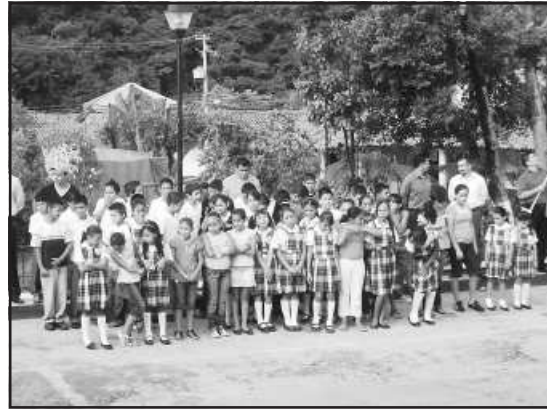
Alumnos de los diferentes centros educativos del municipio de Carácuaro, asistieron a la ceremonia de inicio del ciclo escolar 2010-2011.