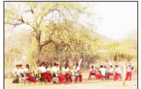
Resulta increíble que los alumnos reciban sus enseñanzas bajo las sombras de un árbol a falta de aulas, y la nula atención de las autoridades a las que les solicitan el alumnado y profesores, les construyan los espacios adecuados y tengan las comodidades necesarias.