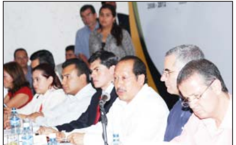
"Queremos dar un trato directo a los ayuntamientos, conocer sus necesidades y buscar juntos la solución", dijo a los gobernantes municipales el gobernador Leonel Godoy Rangel, durante la reunión con los 18 ediles de la región oriental.

En la reunión estuvieron los presidentes municipales de Angangueo, Aporo, Epitacio Huerta, Hidalgo, Juárez, Jungapeo, Maravatío, Ocampo, Senguio, Susupuato, Tiquicheo, Tlalpujahuá, Tuxpan, Tuzantla, Tzitzio, Zitácuaro, Contepec e Irimbo.