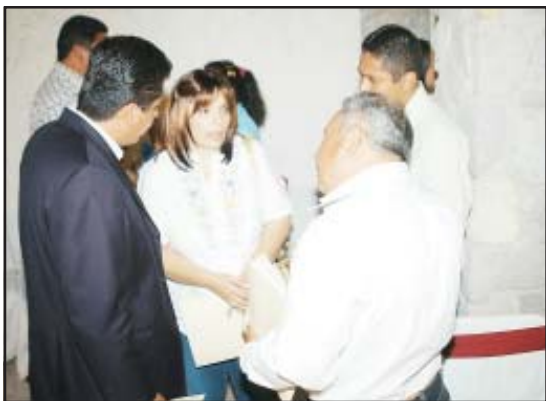
Selene Vázquez Alatorre, secretaria de Política Social, escucha al presidente municipal de Tzitzio, Reynaldo Cortés de las necesidades que enfrenta la población en ese rubro, teniendo a su lado al diputado Antonio García Conejo.

Comentó que se tendrán que atender las necesidades de cada municipio en temas como agua, salud, carreteras, empleo, combate a la deforestación, inseguridad, empleo, demandas que no sólo se tienen en esta región sino en todo el Estado, por lo que el Gobierno del Estado tiene el compromiso de trabajar en conjunto con los ayuntamientos para así poder dar respuesta a las