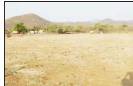
Aunque usted no lo crea, hasta el fondo de esta gran extensión de terreno que pudiera ser utilizado para construir los espacios educativos necesarios, se encuentra un árbol en donde bajo sus sombras se acomodan los alumnos con sus sillas para recibir sus enseñanzas en medio de las incomodidades que esto representa.