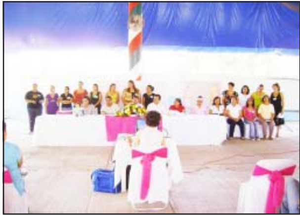
El Consejo Nacional de Fomento Educativo y la Secretaría de Educación Pública han aplicado en el municipio de Huetamo el taller del Programa de Educación Inicial no Escolarizado para abatir el rezago educativo.

En dicho taller participaron 120 promotores educativos, 12 supervisores y 4 coordinadores de zona con sus respectivos supervisores, teniendo como propósito central asegurar que las niñas y niños con mayor vulnerabilidad social, tengan mejores posibilidades de acceso, permanencia y conclusión de la educación básica e intentar cerrar la llave del rezago escolar desde la base de la demanda educativa.