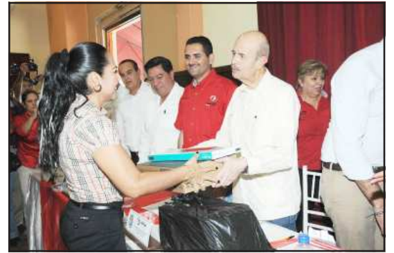
El Gobernador Fausto Vallejo Figueroa, entregó apoyos económicos a comerciantes del municipio de Apatzingán, para reactivar la economía de esa región habitada por la delincuencia organizada.

El secretario de Desarrollo Económico de Michoacán, Manuel Antúnez Álvarez, dijo que con esta primera ministración se contribuirá a la reactivación económica de por lo menos 100 micro y pequeñas empresas del sector comercial, industrial, de turismo y de servicios, mediante la incorporación de: Tecnologías de la Información y Comunicaciones (TIC'S) junto con capacitación, o en su caso, Equipo y Maquinaria ligera, lo anterior con el propósito de que los beneficiarios puedan incrementar su productividad y competitividad, para ello fue destinado un millón de pesos. Este apoyo es de carácter temporal y está focalizado para atender a las empresas afectadas en sus actividades económicas.