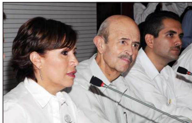
Rosario Robles Berlanga, secretaria de Desarrollo Social, destacó que la estrategia de acciones a favor de la Cruzada Contra el Hambre, está sostenida sobre dos pilares que son seguridad y desarrollo social, habiendo afirmado lo anterior ante el Gobernador Fausto Vallejo Figueroa, anunciando que se aplicarán más de 3 mil millones de pesos en estas acciones del gobierno federal en Michoacán en municipios específicos de alta vulnerabilidad.

Por otra parte, el Estado recibirá dos mil 197 millones para atender a 112 mil 722 adultos mayores de 65 años, quienes recibirán mensualmente una pensión de 580 pesos. De igual forma, se alcanzará a cubrir las 128 mil 768 mujeres afiliadas al seguro para