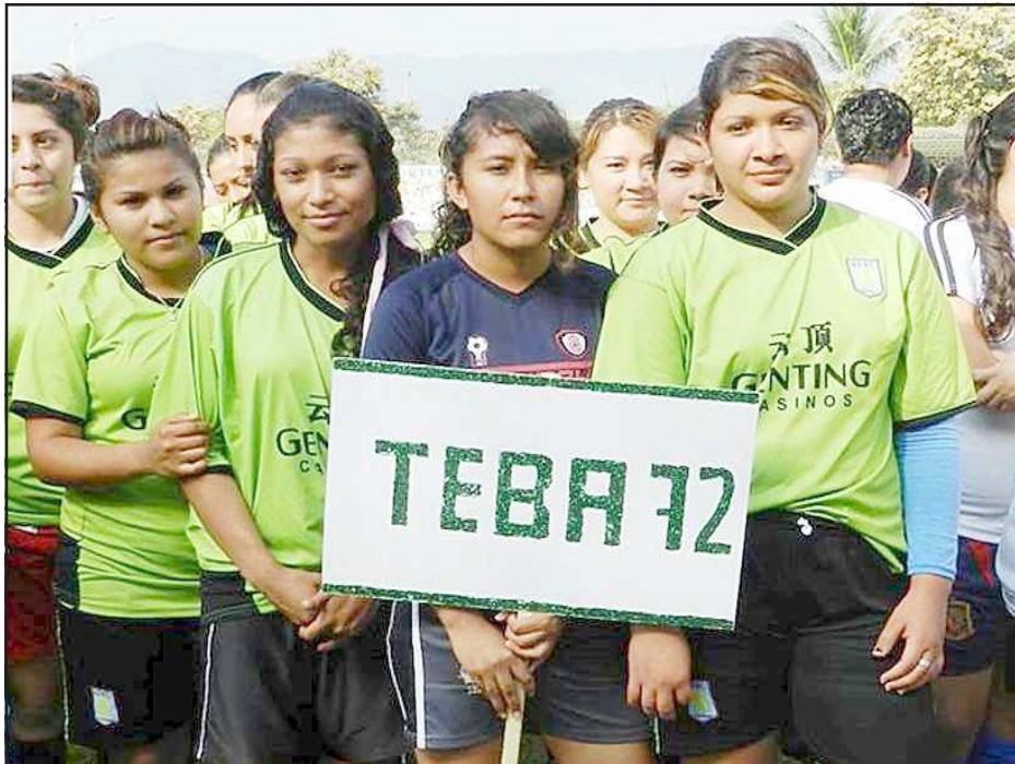
El equipo femenino de Telebachilleres de Santa Rita, es otro que se despidió del torneo, porque no aceptaron la condición impuesta de la liga y demás delegados para jugar sus partidos de local en Huetamo.