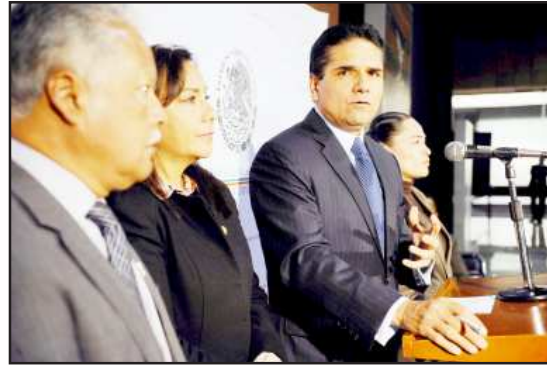
El diputado federal, Silvano Aureoles Conejo, lanzó un llamado al gobierno federal para que atienda urgentemente a los jóvenes del Estado, principalmente a los de Tierra Caliente.

En su mensaje, Silvano Aureoles lanzó un llamado a la Federación para que atienda urgentemente a los jóvenes del Estado, principalmen-