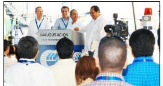
El presidente Felipe Calderón Hinojosa y el gobernador Lázaro Cárdenas Batel, inauguraron la nueva planta de contenedores en el Puerto Lázaro Cárdenas, Michoacán.

Durante la inauguración el mandatario estatal