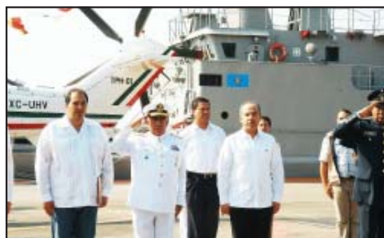
Con motivo del Día de la Armada de México, el presidente Felipe Calderón Hinojosa y el gobernador Lázaro Cárdenas Batel, encabezaron la ceremonia en el Puerto Lázaro Cárdenas.

Cárdenas Batel reiteró que en los últimos cuatros años el puerto ha sufrido una transformación importante, debido al respaldo de empresarios que han apostado a la generación de infraestructura como es el caso de Hutchison Port Holdings, y de las autoridades al pensar en el beneficio para la sociedad más allá de las diferencias partidistas que pudieran presentarse.