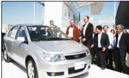
Una muestra de algunos de los modelos de autos de origen del país asiático que serán ensamblados en la planta que se construirá en terrenos del municipio de Zinapécuaro.

Resaltó el mérito, la encomiable labor, el esfuerzo que hizo el gobernador Lázaro Cárdenas Batel para que esa inversión se