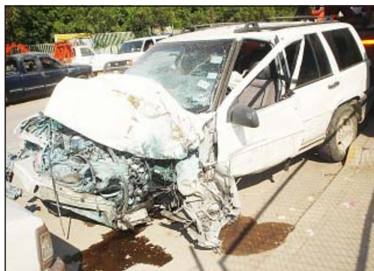
La falta de pericia del conductor y la gran velocidad con la que conducía su camioneta, le ocasionó que perdiera la vida al volcar su vehículo, quedando materialmente destruido.