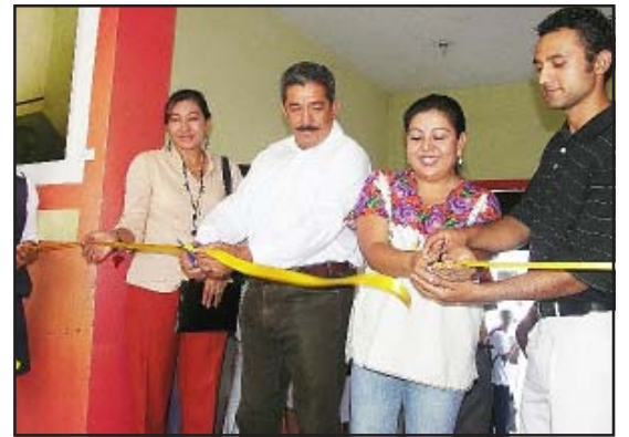
Momentos de la inauguración.

Como parte de incentivar la cultura en Huetamo, la Secretaría de Cultura de Michoacán, el gobierno municipal, y el Consejo de Cultural de esta comuna llevaron a cabo la exposición fotográfica denominada "Instante".