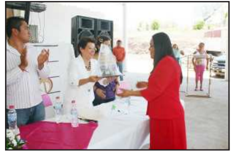
Las cuatro educadoras que cumplieron 20 años de servicio, fueron galardonadas con un reconocimiento a cada una de ellas, por parte de las autoridades municipales y educativas que presidieron la ceremonia alusiva al Día de la Educadora.