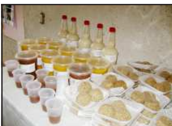
Los cursos de proyectos productivos para la elaboración de panochas, rompopo y pulpas de frutas naturales por parte de las mujeres huetamenses, están dando sus frutos para que tengan una mejor manera de subsistencia.

El taller literario no tiene costo alguno, además de que se otorgarán constancias de participación a todos los participantes del curso literario.