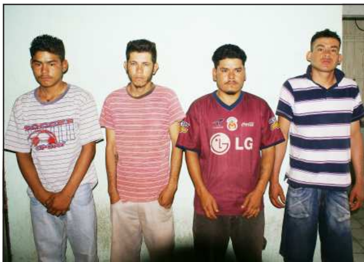
Estos cuatro sujetos dieron brutal golpiza a matrimonio de ancianos para robarles sus ahorros de toda su vida.

De acuerdo a lo que dijo el octogenario ante el agente del Ministerio Público en la ciudad de Huetamo, se pudo conocer que los 4 individuos ingresaron al filo de las 21:00 horas