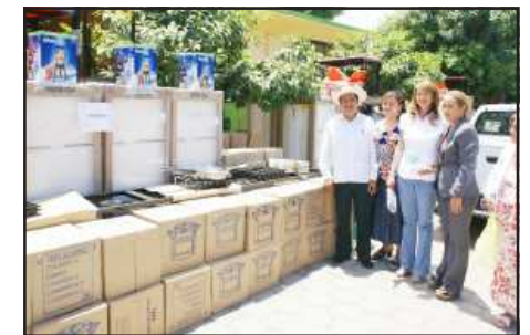
Equipos y material que les fueron entregados a las presidentas de DIF municipales que asistieron para los desayunadores escolares y mejoramiento a la vivienda, proyectos productivos con un valor por casi dos millones de pesos.