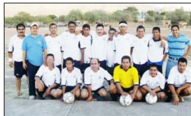
El equipo de la Universidad Michoacana que participa en el torneo Segunda Fuerza de la Liga Municipal "Huetamo", obtuvo su primer triunfo al vencer a Los Mismos la tarde del pasado jueves.