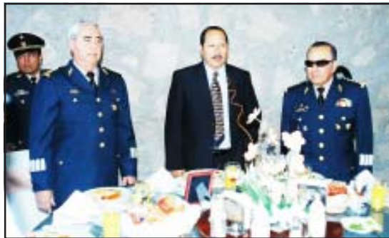
El gobernador Leonel Godoy Rangel, consideró que las fuerzas armadas son un puntal de la defensa de la soberanía nacional, durante el acto conmemorativo al Día del Ejército.