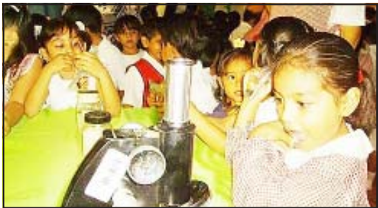
La niñez huetamense pudo admirar los aparatos científicos que fueron expuestos, dándoles las explicaciones necesarias para lo que son útiles.

Las instituciones participantes fueron la Escuela de Psicología, Facultad de Odontología, Facultad de Medicina "Dr. Ignacio Chávez", Facultad de Biología, Facultad de Veterinaria y Zootecnia, Facultad de Ingeniería Mecánica, Escuela de Físico Matemáticas, Escuela Popular de Bellas Artes, Museo de Historia Natural, Facultad de Ingeniería Civil, Instituto Nacional para la Educación de los Adultos e Instituto Tecnológico Superior de Huetamo.