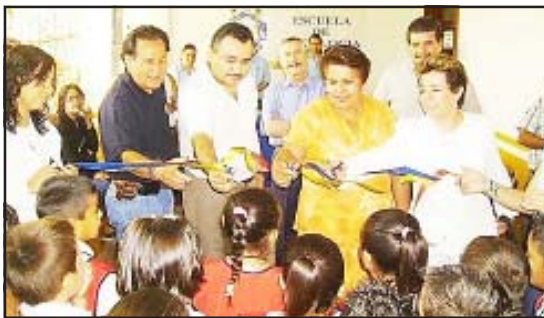
Representantes del sector educativo y del gobierno municipal, convivieron con estudiantes asistentes al Tercer Festival de Ciencias y Tecnología.