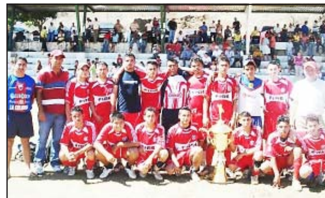
El equipo del CECYTEM, se coronó campeón del Torneo Interno de Fútbol de Carácuaro, ganándole a la escuadra de Los Chelitos, el pasado domingo.