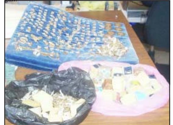
El botín robado recuperado.