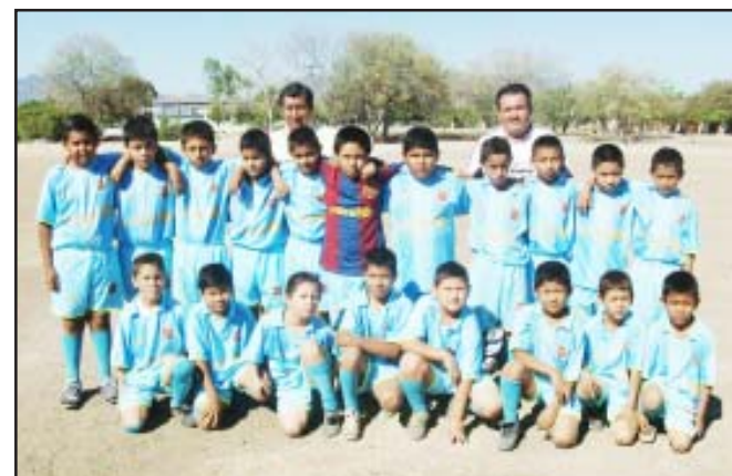
Purechuco categoría Sub 10, después de vencer a la Escuela Emiliano Zapata por 4 goles a 1, es un digno representante de nuestro municipio a nivel zona, suerte jovencitos.