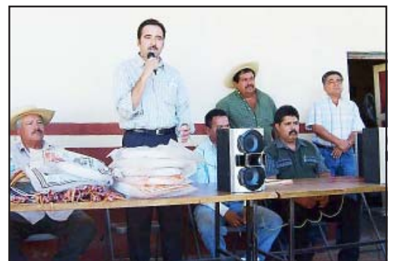
Román Nava Ortiz, presidente municipal de Carácuaro, se comprometió a respaldar todas las acciones necesarias que beneficien al sector ganadero del municipio.

El presidente de Carácuaro, Román Nava, expresó, que buscará la manera más eficaz para respaldar a los socios ganaderos de todo el municipio, comprometiéndose a gestionar ante empresas comercializadoras de carne y puedan los productores vender a mejor precio su ganado. También mencionó que buscará el apoyo del gobierno estatal para la adquisición de sementales y el mejoramiento genético del ganado, manifestó el edil que bus-