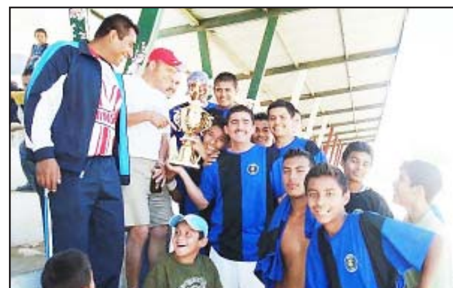
Funcionarios municipales de Carácuaro, hicieron entrega del trofeo que acredita al equipo del CECYTEM como triunfador del Torneo Interno de Fútbol.