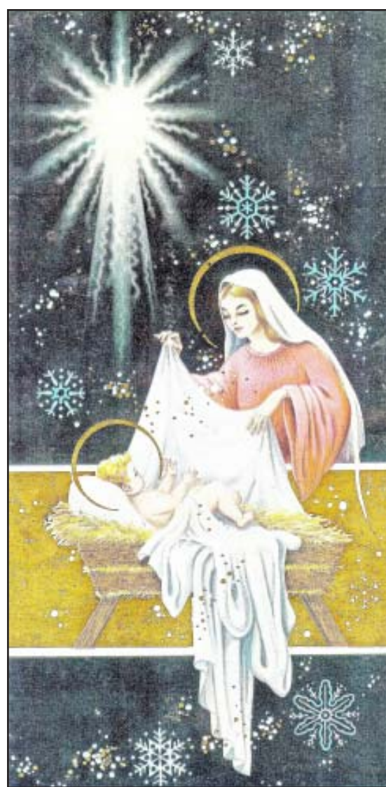
Siglo Veinte les desea a todos sus lectores, anunciantes y amigos, que en esta Navidad reine en sus corazones y en el de sus familiares la paz, amor y felicidad.

Por todo ello, quienes se están beneficiando con este alud de visitantes turistas en esta temporada de fin de año, son los quienes se dedican a la venta de productos para la preparación de alimentos, abarrotes y verduras, así como los prestadores de servicios turísticos, hoteles y restaurantes, balnearios, entre otros.