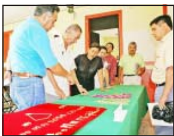
La muestra de sus obras.

Este curso se realiza por iniciativa del ayuntamiento y un grupo organizado de orfebres, quienes gestionaron ante el FONART, quien les apoyó con la cantidad de 83 mil 900 pesos para la preparación de los artesanos, destinado 23 mil pesos para el pago del instructor y el recurso restante para compra del material, siendo es-