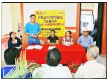
Momento de la clausura.

Por su lado, la Secretaria del Ayuntamiento, mencionó que esta administración municipal ha ofrecido el soporte para que los artesanos orfebres del municipio, mantengan su fuente de empleo y su actividad que identifica a Huetamo en el resto del país y que es orgullo huetamense.