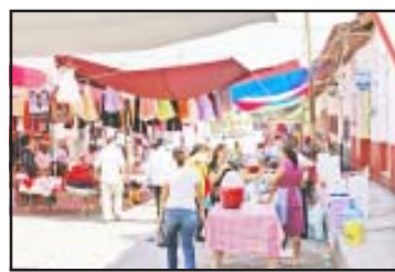
La gente acudió a comprar.

Por último, el entrevistado invitó a toda la ciudadanía de Huetamo, pero principalmente a las amas de casa, a realizar sus compras de víveres y ropa en el tianguis del miércoles, pues ahí encontrará toda clase de productos, en buena calidad y precios justos, además de una excelente atención.