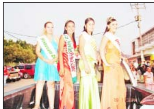
La reina y sus princesas durante el desfile.

Llegada la noche y el desfile a la Unidad Deportiva Simón Bolívar, las autoridades municipales cortaron el listón inaugural y dar comienzo a la muestra agropecuaria, ganadera y comercial más importante de la región, para después realizar un recorrido por todos los stands y expositores.