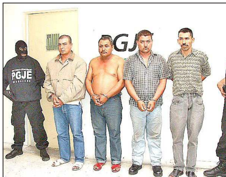
Integrantes de la banda de secuestradores.

un domingo sin SIGLOVEINTE no es domingo Adquiéralo en cualquiera de sus 56 expendios