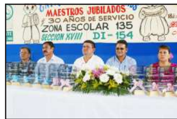
Justo y merecido reconocimiento recibieron quienes han dedicado la mayor parte de su vida al servicio de la docencia.