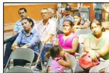
Más de una veintena de personas recibieron los beneficios del apoyo económico que les proporcionó el ayuntamiento de Huetamo e institución crediticia estatal.

De esa forma, microempresarios con giros como panadería, orfebrería, pequeños negocios comerciales y otras actividades, fueron la antecala de un evento que concluyó con la exposición de un curso de capacitación de operadores municipales de Tacámbaro, Carácuaro, Nocupétaro, San Lucas y Huetamo, que se impartieron en el salón de cabildo de Huetamo, en una jornada que dejó una buena derrama en beneficio de la frágil economía huetamense.