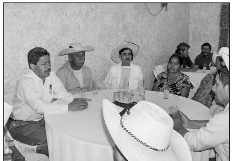
El legislador federal, Emiliano Velázquez Esquivel recibió a diferentes comisiones de campesinos del municipio de Huetamo con quienes intercambió opiniones y sugerencias sobre la problemática del sector campesino al cual ofreció buscar ante las instancias federales pronta solución.

En cuanto a este tipo de reuniones espera escalarlas a un mayor tamaño, éstas en un futuro cercano para tener el contacto con la gente y se sientan escuchados, además de que esto me realimenta para mi labor como legislador, indicó Velázquez Esquivel.