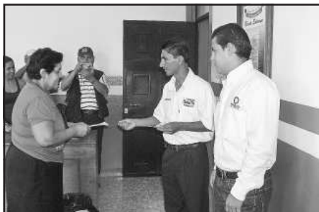
En total fueron quince las personas que recibieron el beneficio de microcréditos para emprender negocios y mejorar los ya actuales que mejorarán las condiciones económicas de cada uno de ellos, así como la reactivación económica del municipio de Huetamo.