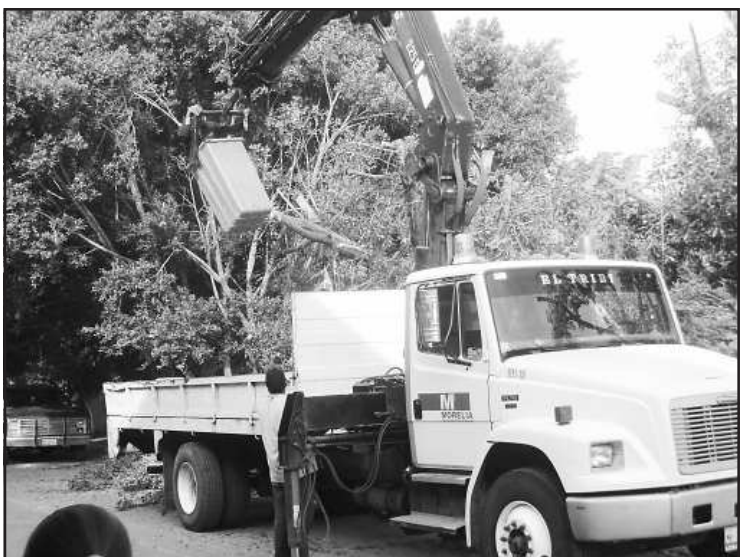
La poda de árboles fue una de las tareas fundamentales del mejoramiento del aspecto urbano de la población de Carácuaro, por órdenes del ayuntamiento, así como la recolección de basura en terrenos baldíos y a orillas de la carretera que comunica a Morelia y Huetamo.

Los árboles impedían el tránsito a través de la banqueta, obligando a los peatones a bajarse y transitar por en medio de la calle, poniendo en riesgo su integridad física y en algunos casos sus vidas al ocurrir algún accidente, porque la calle es muy transitada al ser la principal conexión con el centro del pueblo.