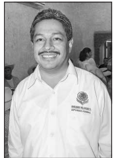
Emiliano Velázquez Esquivel, diputado federal por el distrito VI de Ciudad Hidalgo, conoció las necesidades y problemas del campesinado huetamense, ofreciendo su gestoría para resolver cada uno de los casos presentados al inicio del próximo periodo de sesiones del Congreso de la Unión.

Para finalizar, en entrevista para este medio informativo, Emiliano Velázquez Esquivel, subrayó que como diputado federal michoacano busca acercarse a la gente de todo el Estado para ver las condiciones en las que se encuentran y constatar de viva voz de los afectados por los temporales ya que él pertenece a las comisiones de Desarrollo Rural y a la de Presupuesto y Cuenta Pública, y así puede hacer una mejor gestión por Michoacán.