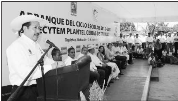
El Gobernador Leonel Godoy Rangel, presidió el acto inaugural del inicio del ciclo escolar 2010-2011 del CECyTEM en la población de Ceibas de Trujillo, municipio de San Lucas, habiendo señalado que su gobierno trabaja para que cada día niños y jóvenes no deserten de estudiar, ofreciéndoles becas que les den la posibilidad de mantenerse en las escuelas.

Tiquicheo, Mich., a 17 de Agosto de 2010.- Al inaugurar el ciclo escolar 2010-2011 del CECyTEM plantel Ceibas de Trujillo del municipio de Tiquicheo, el Gobernador del Estado, Leonel Godoy Rangel indicó que un gobierno que no apuesta por la educación es un gobierno que está condenado al fracaso, ya que no se puede combatir ninguna de las grandes carencias que tiene la población, si no se inicia con la educación. La pobreza, la marginación, la migración y la delincuencia se combaten primero con educación, con salud pública y con empleo para los jóvenes.