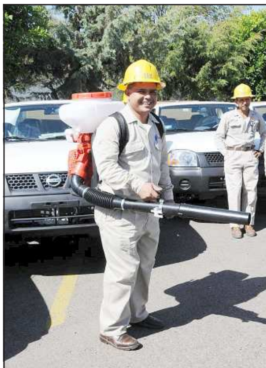
Nebulizadoras, motomochilas y vehículos, les fueron dotados a los integrantes de las Jurisdicciones Sanitarias de la Secretaría de Salud para fortalecer las actividades de prevención y control del dengue.