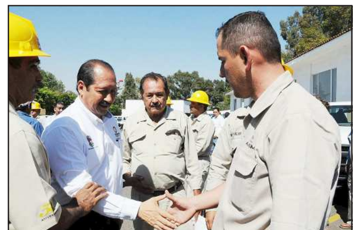
El Gobernador Leonel Godoy Rangel, entregó las llaves de las 52 unidades motrices que serán utilizadas para recorrer los lugares de incidencia del mosquito transmisor de la enfermedad del dengue para preservar la salud de los michoacanos en todo el Estado.