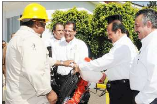
El Gobernador del Estado, Leonel Godoy Rangel, hizo entrega del equipamiento a cada uno de los trabajadores vectores, así como de 52 vehículos para el mejor desempeño en su campaña de sus acciones contra el mosquito transmisor de la enfermedad del dengue.