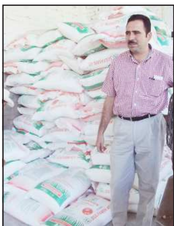
El presidente municipal de Carácuaro, Román Nava Ortiz, ofreció a los agricultores fertilizantes a precios más bajos que comercios establecidos en apoyo a la productividad agrícola del municipio y de su economía.

El alcalde de Carácuaro, Román Nava Ortiz, hizo la entrega simbólica del fertilizante a