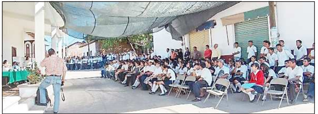
Con enorme éxito por la gran participación estudiantil, se realizó la Tercera Jornada Internacional de Orientación Vocacional, donde el estudiantado huetamense recibió toda clase de información para saber en qué consiste cada una de las carreras profesionales en los centros educativos que ahí se ofertaron.