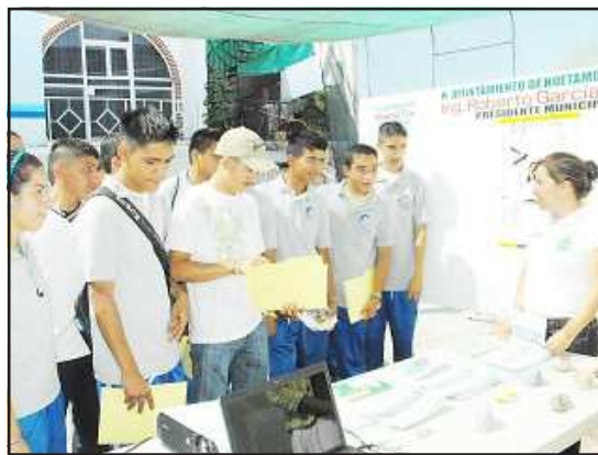
Los estudiantes ávidos de conocer y saber las características de la profesión que pudieran escoger al término de sus estudios preparatorianos y bachillerato, se acercaron a los módulos donde recibieron orientaciones orales e impresas.