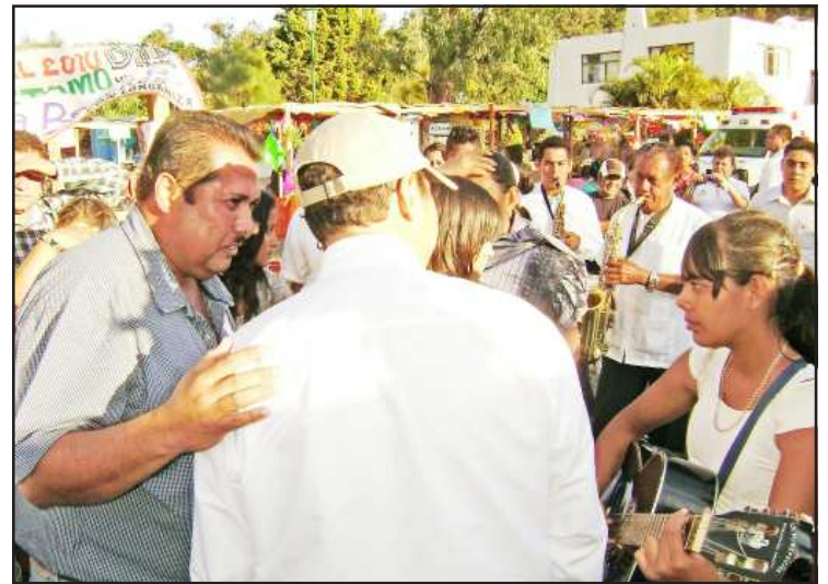
Con una banda de música de viento y regalos, fueron recibidos los distinguidos visitantes al stand que presentó el DIF de Huetamo, donde el gobernador y su esposa pasaron gratos momentos de alegría y saborearon algunos de los alimentos que se pusieron a la venta, para recaudar fondos para la compra de aparatos auditivos y sillas de ruedas.