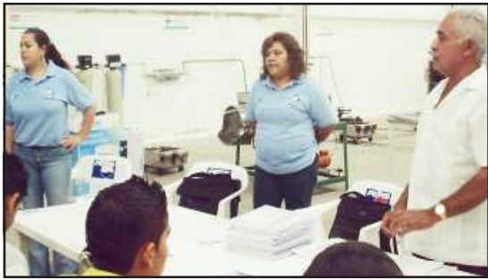
Aprender a elaborar diversos productos por medio de la transformación de chiles, frutas y otros productos del campo, mediante del proceso de su conservación y emvasado para su comercialización, recibieron capacitación grupos de personas por parte de personal de la Procuraduría Federal del Consumidor.