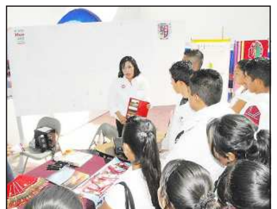
Amplias explicaciones recibieron los alumnos.