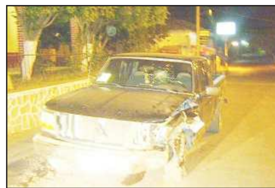
Peor quedó el otro vehículo.

Los vehículos involucrados fueron una Ford, color negro, con placas de circulación MW-23150, cuyo conductor huyó del lugar y, una Ford, negro, placas