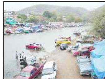
No obstante de la lluvia, así lucieron las márgenes del río Carácuaro con familias que llegaron a bordo de sus vehículos para disfrutar de las tibias aguas, después de haber visitado para hacer oración ante el Señor Crucificado de Carácuaro.

Cabe señalar que el temporal de lluvias que recientemente afectó a gran parte del país, disminuyó el número de personas asistentes, comparados con otros años que provocaron que algunos comerciantes se quejaron por la baja en sus ventas, mientras que el río Carácuaro lucía abundante caudal de lado a lado y con gran fuerza.