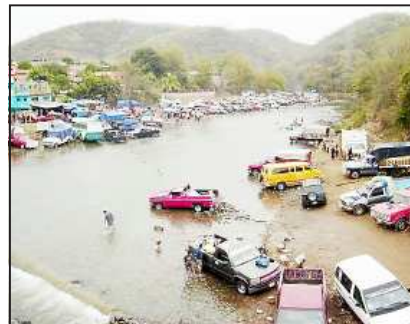
La pertinaz lluvia de tres días hizo que el río subiera su cauce, provocando que hubiera pocos bañistas.