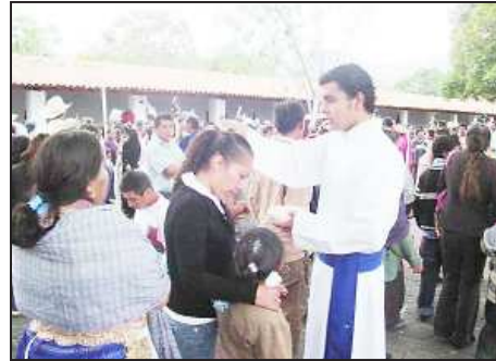
Centenares de peregrinos entraron de rodillas desde la puerta del atrio, hasta el interior del templo para postrarse ante el altar donde se venera al Señor Crucificado de Carácuaro en señal de agradecimiento por favores recibidos. En el atrio durante todo el día miércoles les fue impuesta la ceniza a miles de católicos que acudieron en tan significativo día al recordar que "polvo eres y en polvo te convertirás".