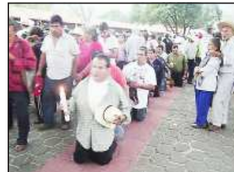
Largas filas de peregrinos durante todo el día entraron de rodillas al templo para postrarse ante el Cristo Negro o Señor Crucificado de Carácuaro en su día el "Miércoles de Ceniza".