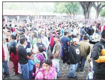
Miles de peregrinos se dieron cita en Carácuaro el Miércoles de Ceniza.