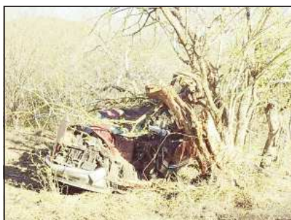
Completamente destruido quedó el vehículo después de chocar contra un árbol, habiendo perdido la vida tres personas y dos más heridas como consecuencia del exceso de velocidad y el estado de embriaguez del conductor.