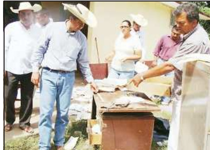
Las diversas zonas agrícolas siniestradas por las intensas lluvias en el municipio de San Lucas, fueron visitadas por el diputado Antonio García Conejo, acompañado por el presidente municipal, Servando Valle Maldonado, habiéndose percatado el legislador de las enormes pérdidas económicas que sufrieron los agricultores del municipio, por lo que ofreció tomar medidas de gestión para su ayuda.