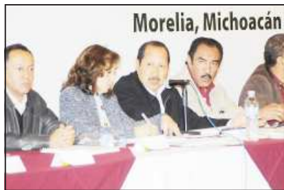
El gobernador Leonel Godoy Rangel, dijo durante la reunión que el tema de los siniestros se verá de manera especial y se cuenta con 77 millones de pesos para los afectados por las lluvias.

□ Leonel Godoy presidió primera Sesión Extraordinaria 2010 del Consejo Estatal para el Desarrollo Rural Sustentable. Fue aprobada la propuesta para el 2010, en la que se contemplan los programas activos, soporte, actores para el desarrollo y uso sustentable.