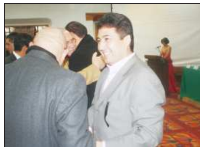
El diputado federal por el distrito de Pátzcuaro, Víctor Báez Ceja, acudió al VIII Foro Nacional de Turismo, donde destacó la importancia de elevar al turismo a rango constitucional.

que emita el Reglamento de la Ley General de Turismo -que ya lleva mucho tiempo de retraso-; y por otro lado, que se trabaje en una propuesta para elevar al turismo a rango constitucional, finalmente, el diputado Báez comentó que para lograr esto último, se necesitará impulsar ese gran acuerdo.