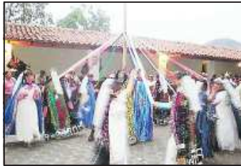
En el atrio decenas de grupos de danzantes ejecutaron sus bailes en honor al Señor Crucificado de Carácuaro, que llegaron de tierras lejanas para orar ante su imagen.