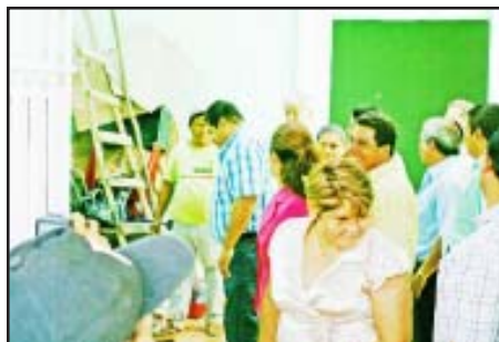
La remodelación de diversas áreas de la cárcel preventiva de la policía municipal, lleva un 80% de avance, explicó el presidente municipal.