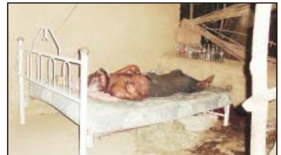
Sobre su cama quedó inerte su cuerpo del anciano mayor de 80 años, de quien se supone murió a causa de un infarto debido a lo avanzado de su edad, según sus familiares y el médico legista que conoció la tragedia.

Esta el lugar se presentó el agente del Ministerio Público en turno para dar fe de la muerte del octogenario, indagando el representante social que el anciano vivía solo desde hace años, además que padecía de sus facultades mentales y que sus vecinos y pobladores de Angao lo apoyaban con comida desde hacía varios años. El cuerpo fue localizado por dos niñas que se introdujeron a su domicilio y al ver el cuerpo en la cama que se encontraba en el corredor, de inmediato dieron aviso a sus familiares, mismos que dieron aviso a las autoridades policiales, encontrando el cuerpo en avanzado estado de descomposición.