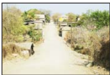
La compactación de varias calles de esta ciudad para después recibir su pavimentación, fue otra de las escalas importantes de esta gira de trabajo del gobernante huetamense al cumplirse sus primeros 100 días de gobierno.