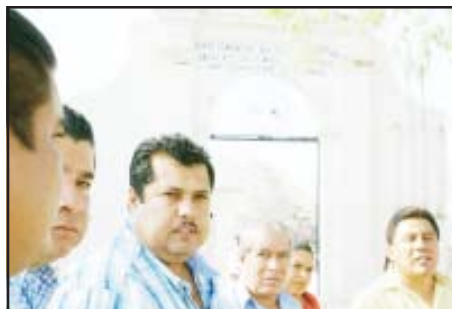
El presidente municipal Roberto García Sierra, mostró el avance de la pavimentación de la calzada que conduce al panteón.