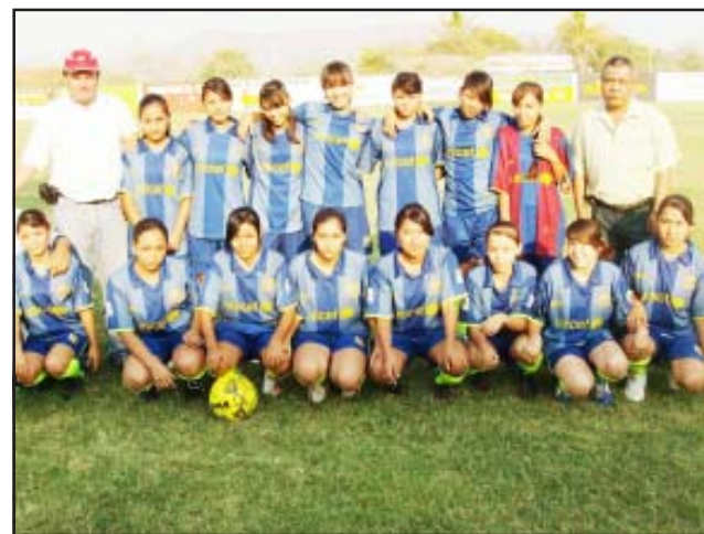
De lo rescatable en la Copa Coca-Cola, es el fomento al futbol en la categoría femenil, en este caso del equipo de la escuela secundaria No. 1, que logró colarse a la gran final.

comentamos que se jugó la fecha 3, decisiva fue para saber quiénes serían los finalistas y para darse cuenta de las anomalías que se siguen dando en algunas escuelas con sus amaños entrenadores, pues en la categoría varonil la Telesecundaria de San Jerónimo no le alcanzó para poder pasar a la final, ya que la 24 de Febrero de Comburindio tras perder ante Escuela Secundaria N° 1 de Huetamo, pero se rumora que tanto la de Comburindio y San Jerónimo traían jugadores pasados de edad, la muestra está que la de Comburindio no alineó a esos jugadores por ello la derrota vergonzosa ante la Miguel Hidalgo y Costilla. Lo cierto que la próxima semana se jugarán las finales y ahí nos daremos cuenta de la segunda parte de este torneo que perdió espectacularidad.