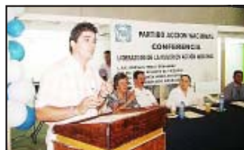
Transformación de la Cultura Política en México, fue el tema que desarrollaron las legisladoras federales panistas a las asistentes de varios municipios de esta región que militan en Partido Acción Nacional.

Por último, panistas hueta-menses expresaron a las congresistas, algunas necesidades de apoyo con asesoría para acceder a los programas federales,