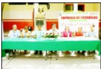
En el patio del palacio municipal, el gobernante huetamense Roberto García Sierra, entregó un millón 160 mil pesos a 43 planteles educativos del programa “Escuelas de Calidad” para que sean aplicados en la conservación y mejoramiento de sus instalaciones, les dijo.