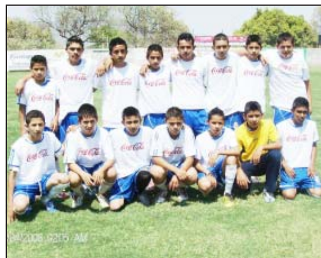
Los estudiantes de la Escuela Secundaria 24 de Febrero de Comburindio, también lograron entrar a la gran final en un partido que será parejo contra los de la Escuela Secundaria Miguel Hidalgo y Costilla.