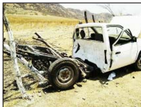
Así quedaron los dos vehículos que chocaron de frente, que afortunadamente no hubo muertos que lamentar, sólo una persona resultó lesionada pero no de gravedad.

Un herido fue el saldo que dejó un choque entre dos camionetas cuando se impactaron de frente, hechos suscitados la mañana del miércoles en la carretera estatal Huetamo-San Jerónimo, a la altura de la localidad de Puertas Cuatas, perteneciente a esta municipalidad.