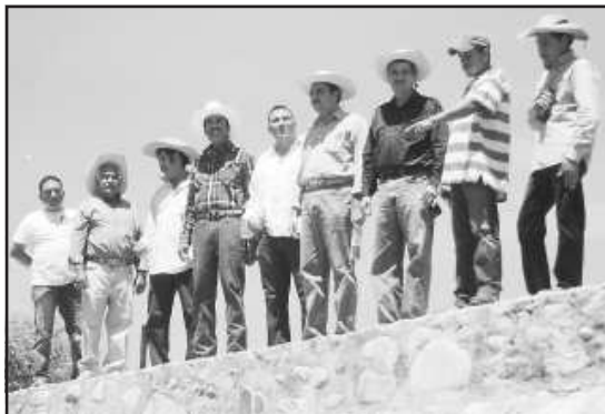
Desde lo alto del dique de contención de la presa, los funcionarios admiraron la magnitud de la monumental obra que habrá de beneficiar a los campesinos de las comunidades de La Carrera y Acuyo.

Además del edil estuvieron presentes, el secretario del ayuntamiento, el director de Obras Públicas, el regidor del Deporte y la Mujer, el tesorero municipal, el director de Desarrollo Rural y el director de Servicios Municipales, el jefe de tenencia de Paso de Núñez y el encargado del orden de la comunidad de Zapote de Coendeo.