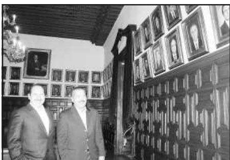
Las fotografías y pinturas de quienes fueron gobernadores le fueron mostradas por el gobernador Leonel Godoy, así como desde el balcón central de palacio de gobierno el paisaje ciudadano de la principal avenida de Morelia, su majestuosa catedral, su plaza de armas y la moderna plazuela Melchor Ocampo al senador Manlio Fabio Beltrones.

Al recorrido por los pasillos de Palacio de Gobierno, acompañaron al Gobernador Leonel Godoy Rangel y al Senador Beltrones Rivera, el alcalde moreliano Fausto Vallejo Figueroa y el presidente del Consejo Coordinador Empresarial, Manuel Nocetti Tiznado.