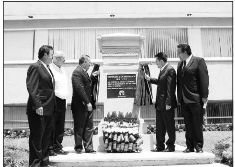
El senador Manlio Fabio Beltrones y el presidente del CDE del PRI, Mauricio Montoya Manzo, develaron la placa conmemorativa al Bicentenario del inicio de la Independencia de México, en las instalaciones del instituto político en Morelia.

En tono mesiánico, confesó: “Una de las principales muestras de que el priísmo nacional está con el priísmo michoacano es mi presencia, no obstante que tenga la doble calidad tanto de presidente del Senado, como de coordinador