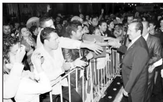
El Gobernador Leonel Godoy Rangel, al término de la ceremonia del "Grito", saludó a cientos de personas en señal de agradecimiento por su presencia, para demostrar que los michoacanos quieren vivir en paz y en armonía social.