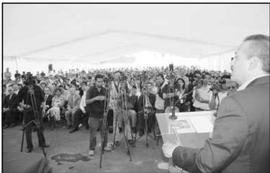
Manlio Fabio Beltrones, líder del Senado, llamó a los priístas de Michoacán a cerrar filas en torno a la unidad para tener posibilidades de triunfo en el 2011, en vez de repartirse culpas o lanzarse acusaciones entre unos y otros.

“Una de las principales muestras de que el priísmo nacional está con el priísmo michoaca-