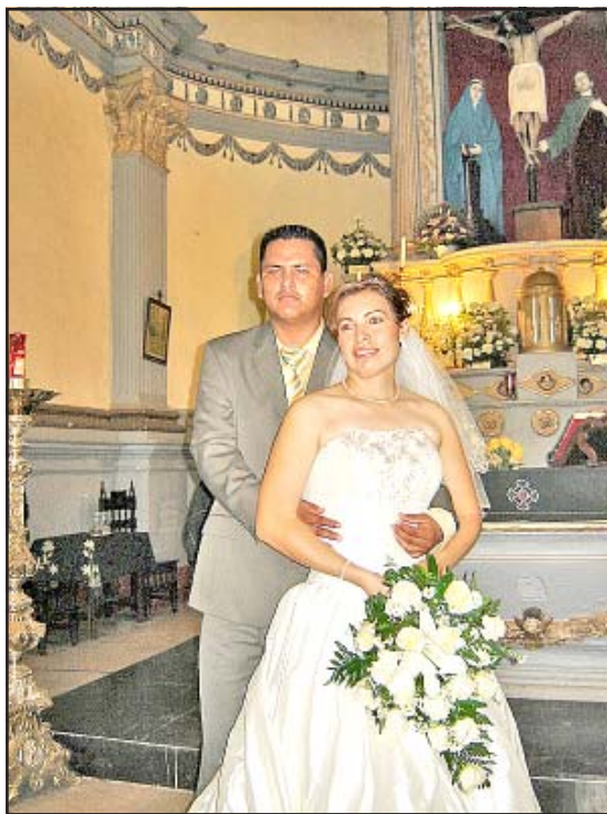
Los nuevos esposos.

Mientras tanto frente al sacerdote, los novios permanecieron atentos e irradiaban felicidad y emoción por la ceremonia que uniría sus vidas