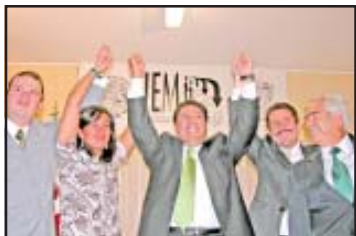
Centenares de militantes priístas victorearon a su candidato a gobernador.

Destacó que "el trabajo y el tiempo nos darán la razón y los resultados llegarán por sí solos, la ciudadanía merece respeto y no caeremos en la guerra de declaraciones ellos tienen la última palabra, yo tan sólo les ofrezco trabajar para sacar a Michoacán y a su gente adelante".