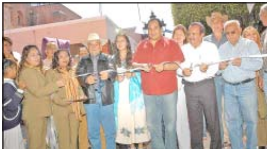
El gobernador Lázaro Cárdenas Batel, inauguró en la población de Queréndaro la Feria del Chile, ante autoridades municipales, la Reina del Chile y habitantes del municipio.