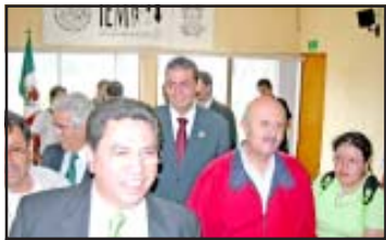
Jesús Reyna, a su llegada a las oficinas del Instituto Electoral de Michoacán.

El candidato de unidad del Partido Revolucionario Institucional por la gubernatura del Estado, Jesús Reyna Gracia, se registró ante el Instituto Electoral de Michoacán (IEM) como aspirante único de ese instituto político. Ante la presidenta del organismo electoral, María de los Angeles Llanderal Zaragoza y miembros del consejo general recibieron de manos del candidato la documentación.