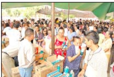
"El DIF Siempre Llega".

Brindar asistencia a los sectores más vulnerables ha sido una tarea que el Sistema para el Desarrollo Integral de la Familia ha realizado de manera ininterrumpida durante la actual administración, que en la recta final sigue de cerca y dándole la mano a la población de las zonas más alejadas.