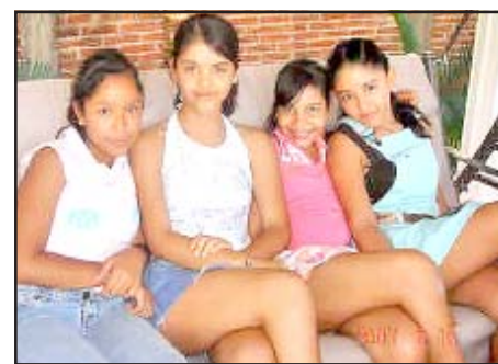
Nuestras amigas que domingo a domingo no se pierden a el Rolando Ando.