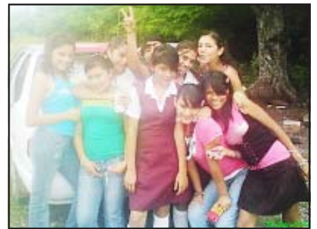
Chavas de la Secundaria N° 2.

Nos vamos no sin antes dejarles unas frases para todas aquellas personas corruptas, la primera es "La unión hace la fuerza" y la segunda es "que cuando el pueblo se cansa se vuelve monstruo que aplasta" esto haciendo alusión a futuras elecciones al interior de ciertos partidos donde seguramente se dejará ver la mano negra de ciertas personas que se sienten los amos del poder.