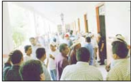
Decenas de personas acudieron al palacio municipal para exponerles su queja a los funcionarios del ayuntamiento a quienes les han asegurado que los terrenos donde se juega la pelota tarasca ha sido invadido con una construcción.