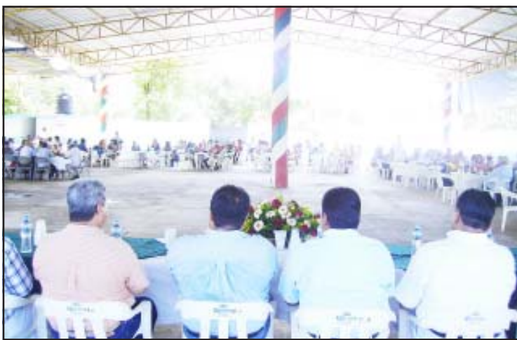
El ayuntamiento de Huetamo ofreció un convivio a todos los colaboradores pertenecientes a los tres sindicatos al servicio del gobierno municipal con motivo del Día del Empleado Municipal que fue presidido por el presidente municipal, Roberto García Sierra.