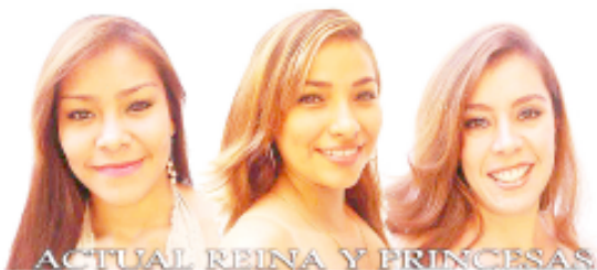
ACTUAL REINA Y PRINCESAS

PROMOCION: Inscripcion GRATIS Presentando este anuncio