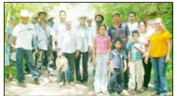
Nuevos miembros de los CODECOS.

Los nuevos miembros de los CODECOS mencionaron que les da mucho gusto que de nuevo se pongan en marcha estos proyectos, ya que temían que estos programas no iban a seguir funcionando, además de