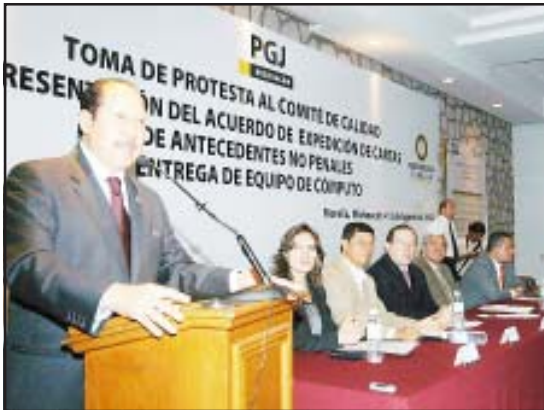
El gobernador Leonel Godoy Rangel, afirmó que son tiempos difíciles donde la voluntad y las convicciones, así como la honestidad a prueba de todo, son las que pueden ayudar a cumplir mejor la procuración de justicia.

mi apoyo absoluto a nuestra Procuraduría General de Justicia, reitero que debemos estar unidos, si se ofende o se amenaza a alguien de la Procuraduría, nos ofende y nos amenaza a todos; ustedes con honestidad, integridad y calidad moral van a poder salir adelante y en eso depositamos nuestra confianza, tenemos un extraordinario procurador y el equipo de subprocuradores debe estar a la altura de la circunstancia”.