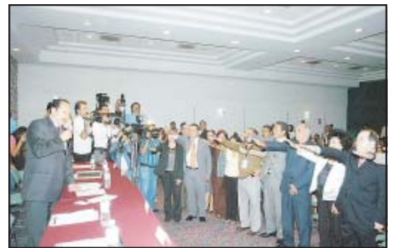
En la lucha contra la delincuencia, el gobernador Leonel Godoy Rangel tomó protesta a los integrantes del Comité de Modelo de Calidad de la Procuraduría General de Justicia del Estado.