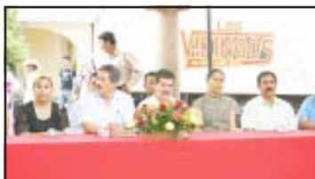
Con una ceremonia cívica se conmemoró el CDLIV aniversario de la fundación de la ciudad de Huetamo por los evangelizadores franciscanos.