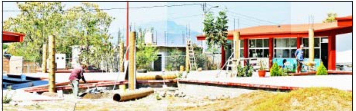
En construcción el salón de usos generales del Centro de Atención Múltiple, requiere del apoyo de la ciudadanía y de las autoridades municipales para su terminación, informó su directora Salud Irepan Zúñiga.

También se informó sobre la prevención del SIDA y se promovió la prueba de detección del VIH; se completaron los esquemas de vacunación en menores de cinco años y se ofrecieron vacunas contra influenza y neumococo a los adultos mayores. Se inició la atención durante el embarazo, se realizaron detecciones de tuberculosis en los tosedores crónicos y se ofreció atención dental.