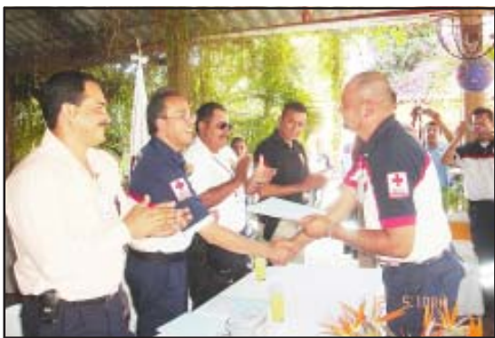
Socorristas de la Cruz Roja huetamense recibieron reconocimientos por su labor altruista y desinteresada.

Para el inmueble se tiene contemplada una inversión de aproximadamente de 2 millones 800 mil pesos, el cual contará con dos niveles y todas las áreas necesarias que se requieren, brindando un buen servicio de urgencias, ya que es una de las funciones primordiales de la institución, señaló el delegado estatal Ignacio Gallardo.