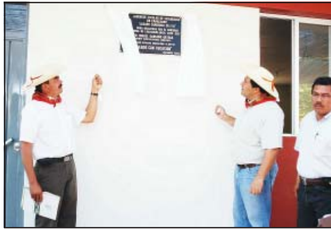
El gobernador del Estado, Lázaro Cárdenas Batel y el presidente municipal de Carácuaro, Ismael Garduño Ortega, develaron la placa inaugural del Albergue Escolar para el nivel de Secundaria "Lázaro Cárdenas del Río".

Al respecto, Cárdenas Batel destacó la importancia de que se concretara