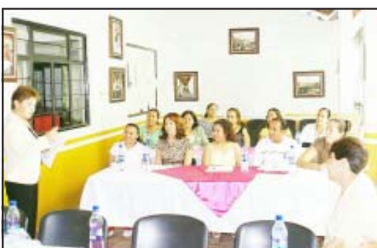
Personal recibiendo capacitación.

Con la asistencia de enfermeras de la región e incluso del Estado de Guerrero, tanto del Sector Salud como de la iniciativa privada, Esbeyde García comentó que en la región existen poco más de 150 enfermeras, de las cuales 68 pertenecen al Colegio de Enfermeras, agregando que el nivel es muy bueno y que se mantienen constantemente actualizadas, para un mejor cuidado de los pacientes, señalando además que este tipo de jornadas son libres para todo público que quiera asistir.