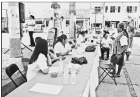
Poca asistencia ciudadana en la Feria de la Salud, efectuada en esta ciudad en la pérgola del jardín principal.

El jardín principal fue el lugar donde se instalaron módulos de atención para toda la población, principalmente los emigrantes que