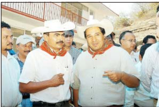
El gobernante caracuarenses y el gobernante estatal, durante el recorrido por las instalaciones del albergue escolar, constataron la funcionalidad de las instalaciones.

ese espacio educativo, pues dijo que sin importar tintes partidistas, los gobiernos trabajaron para lograr ese proyecto.