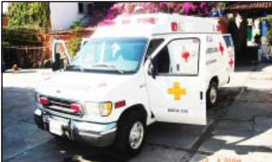
Personal de la Benemérita Cruz Roja de Huetamo recibió con júbilo y satisfacción la nueva ambulancia.