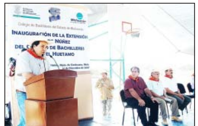
El Gobernador Lázaro Cárdenas Batel, inauguró las nuevas instalaciones del edificio de la extensión en la tenencia Paso de Núñez del Colegio de Bachilleres de Huetamo, haciendo un recorrido por las aulas de este centro educativo de nivel medio superior, habiendo dirigido un mensaje sobre la importancia que su gobierno le ha brindado al sector educativo durante su mandato sin importar tintes partidistas.