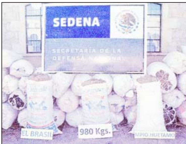
En 59 costales fue encontrado el enervante.

ron a disposición del agente del Ministerio Público de la federación para que integre la averiguación previa penal correspondiente por delitos contra la salud. En el lugar, los militares realizaron una demostración con el GT-200, donde se pudo comprobar que con la tarjeta electrónica el aparato detectó el enervante que estaba en los costales decomisados en Huetamo.