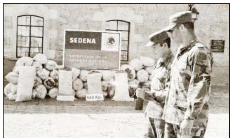
Con el detector molecular GT-200 se logró la localización.

Elementos de la Policía Ministerial del Estado esclarecieron el homicidio de un joven que fue muerto a pedradas en la cabeza, mediante la captura de uno de dos presuntos responsables del crimen.