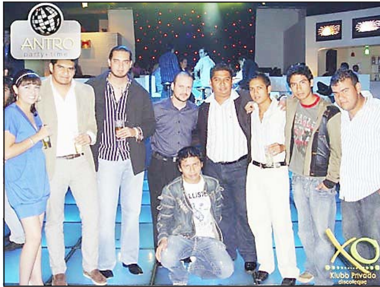
Cumpleaños de Idi.

Ahora queremos saludar a nuestro amigo Poncho de