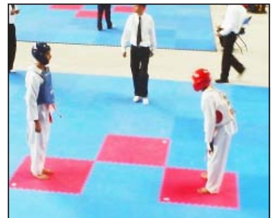
Gran esfuerzo realizaron en los combates el equipo de Taekwondo del Instituto Tecnológico Superior de Huetamo.

Se pudo conocer que los beneficios de la práctica de este deporte son que los alumnos se les prepara físicamente, teniendo un cuerpo saludable, una mente más ágil, por lo que están preparados para enfrentar los diferentes problemas que en el transcurso de la vida se presenten, ya sean físicos o emocionales, formando carácter de triunfadores.