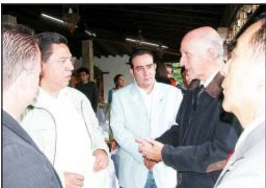
El candidato del PRI a la gubernatura del Estado, Jesús Reyna, escuchó con atención los planteamientos que le hicieron algunos de los integrantes de la "Sociedad en Movimiento" con quienes tuvo puntos de acuerdo.

Por ello, agregó que Jesús Reyna no aceptará ningún voto en base a descalificaciones, ninguno que se obtenga en base a promesas, el voto para el PRI se sustentará en propuestas propositivas, incluyentes y que verdaderamente redunden para el Michoacán que todos queremos: De seguridad, certidumbre y crecimiento económico que redunde en beneficio de todos.