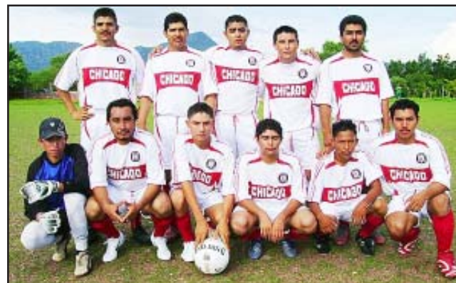
Purechucho, el equipo anfitrión que esta mañana estará disputando el trofeo "Rigoberto Oviedo Castro". Suerte al igual en el Torneo de Barrios 2007, evento en que también están participando.