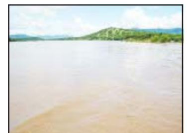
El Río Balsas se encuentra a su máxima capacidad por los torrenciales aguaceros que se han registrado en todo el país, poniendo en alerta a las autoridades municipales de San Lucas en caso de que sus aguas invadan una tenencia y varias comunidades cercanas que se encuentran cercanas al caudaloso río.