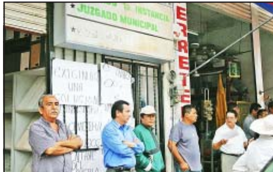
En la vía pública, afuera de las oficinas del Juzgado de Primera Instancia, grupo de personas se manifestaron pacíficamente para que no se llevara a cabo el remate de la central de autobuses, inmueble considerado como patrimonio de todos los huetamenses.

Después de las negociaciones de las partes en este conflicto ante el Juez de Primera Instancia del Distrito Judicial de Huetamo, licenciado David Alcalá, se determinó una prórroga hasta