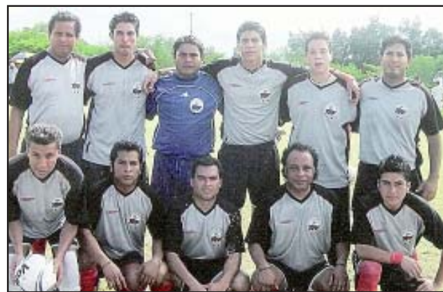
Halcones del Imperio como cada año, visita estas tierras para participar por 28° ocasión en el cuadrangular de las Fiestas Patrias de Purechucho.