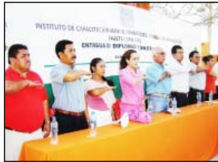
En emotiva ceremonia egresaron 225 alumnos capacitados en las diferentes ramas de la productividad.

El Instituto de Capacitación para el Trabajo del Estado de Michoacán, plantel San Lucas, festejó el jueves pasado, 12 años de fructífera capacitación para miles de alumnos sanluquenses y de otros municipios aledaños para el mejoramiento del nivel de vida de nuestra región.