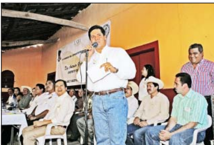
El diputado Antonio García Conejo, durante su mensaje a la ciudadanía, puso de manifiesto su deseo de atender a todos por igual, sin distinción de ninguna clase por reconocer que es un servidor público como legislador y gestor de los problemas que aquejan a los habitantes del XVIII Distrito Electoral local.