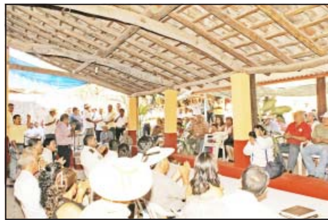
La amplitud de la Casa de Enlace y Gestoría permitió la asistencia de infinidad de personas.

Dicho encargo no sólo me genera derechos, también me conlleva obligaciones, dentro de las cuales nuestra misma Constitución especifica que es obligación de los diputados el gestionar ante las autoridades correspondientes a nombre de sus representados, es decir todas y todos