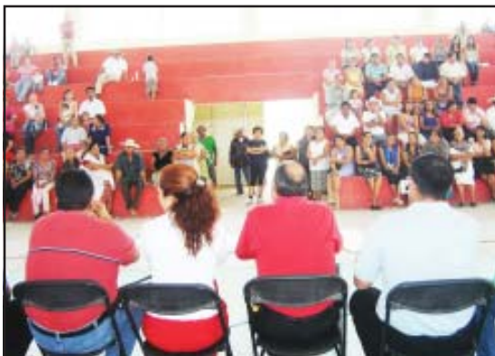
Familias huetamenses de escasos recursos asistieron a la sesión informativa para integrarse al padrón para que puedan acceder al beneficio que representará la construcción de sus hogares con adobe y tengan una vivienda digna.

Así mismo, Mejía Sosa, indicó que la construcción más grande que podrán hacer es de 10 por 15 metros para una vivienda completa, igualmente para aquellas personas que se construyan la casa, para su división en recámara, baño o cocina, podrán utilizar un material conocido como ecomadera que se fabrica en Sahuayo, y que es más resistente que la tablaroca, que tiene un costo de 10 a 12 mil pesos el millar de hojas, pero que él se las facilitaría sin ningún costo.