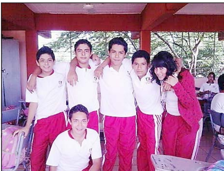
Chavos de la Secundaria N° 2.