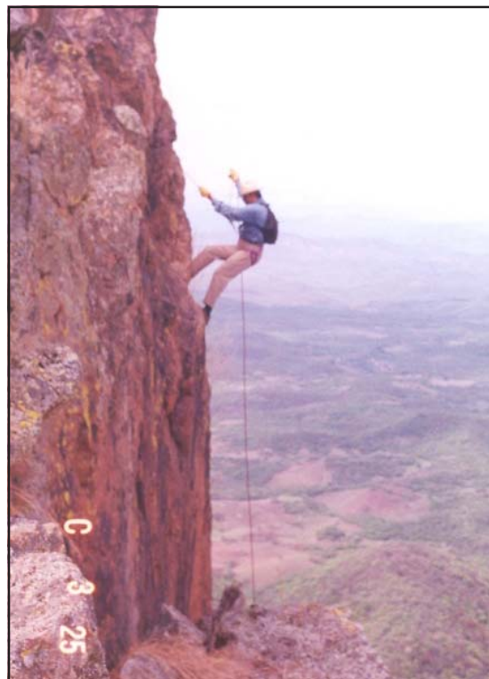
Rappel en el Cerro del Morán.

En el siguiente escrito les contaré de un lugar casi mágico de gran belleza y cerca de Huetamo.