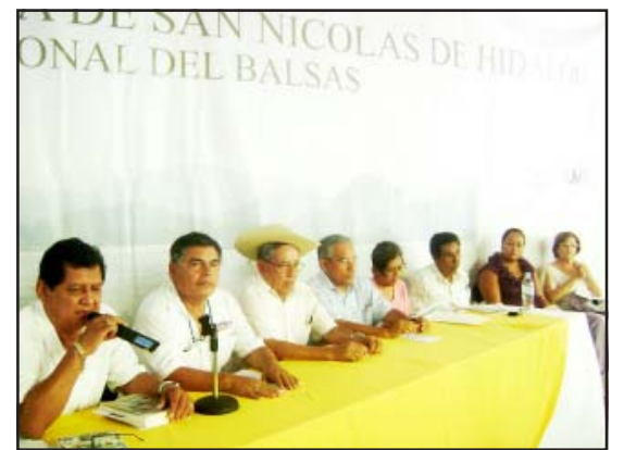
Diferentes personalidades del conocimiento de la composición y el canto de la música de Tierra Caliente, presidieron el 6º Festival de Compositores y Trovadores.

La UNIP Huetamo presentó un selecto elenco encabezado por el compo-