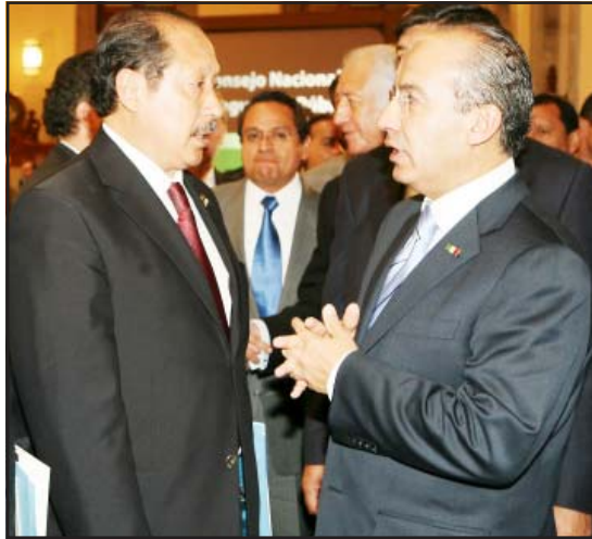
El Gobernador Leonel Godoy Rangel, dio a conocer al presidente Felipe Calderón Hinojosa, la diversidad de obras prioritarias en el Estado para que sean incluidas en el presupuesto de egresos para el año próximo.

El gobernador Godoy Rangel continuó con la labor de cabildeo a favor del presupuesto en beneficio de los michoacanos, por lo que desayunando con Beatriz Paredes Rangel, dirigente nacional del Partido Revolucionario Institucional (PRI); sostuvo junto con los demás gobernadores emanados del Partido de la Revolución Democrática (PRD) una reunión de trabajo en Palacio Nacional, con Agustín Carstens, secretario de Hacienda, y terminó con una reunión con el diputado Francisco Rojas Gutiérrez, coordinador del grupo parlamentario del PRI en la Cámara de Diputados.