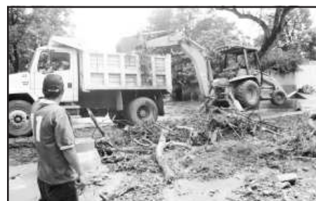
Brigadas del personal de limpieza del ayuntamiento de Huetamo, realizaron trabajos extraordinarios al bajar los niveles del agua en arroyos y calles para que volviera la normalidad de los habitantes, después de los estragos causados por las inundaciones.