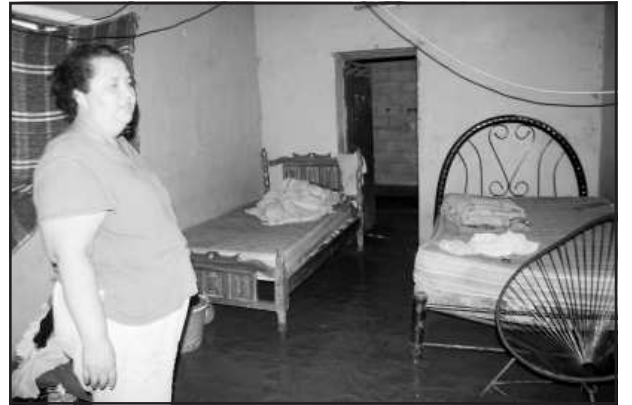
La falta de un declive apropiado en las calles recientemente pavimentadas y la ausencia de coladeras para las aguas pluviales, en cada temporada de lluvias ocasiona que algunas familias sufran las consecuencias de que el agua se introduzca a sus hogares ante la ausencia de fluidez del líquido, cuyo problema debe ser resuelto por las autoridades municipales, opinan los habitantes de los hogares perjudicados con las inundaciones en el interior de sus viviendas.