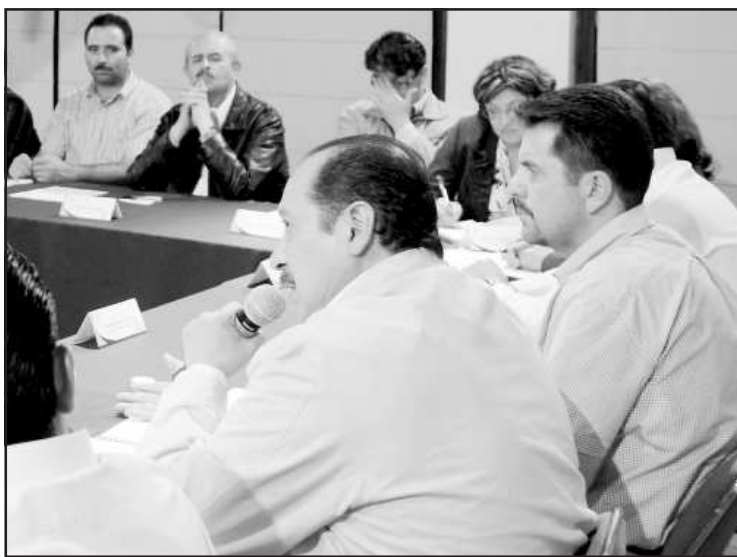
Al reunirse el mandatario michoacano, Leonel Godoy Rangel, con los alcaldes michoacanos, destacó que al ser el PRI el partido que gobierna más alcaldías, para el gobierno del Estado resulta fundamental mantener la comunicación y coordinación con sus alcaldes.

Godoy Rangel destacó que las diversas dudas respecto a la implementación de programas como la entrega de fertilizante, serán revisados