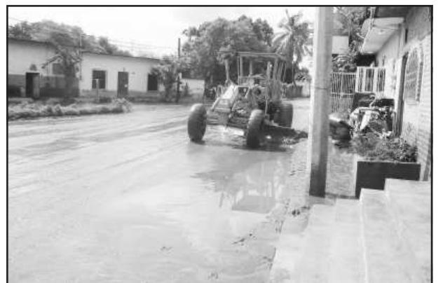
El desbordamiento de los arroyos Cahuaro, Urapa y Cútzco, por los torrenciales aguaceros que recientemente se han registrado durante los días iniciales de la semana pasada, las calles de las distintas colonias de la ciudad de Huetamo, se vieron invadidas por el lodo que arrastró el agua, siendo necesario que con maquinaria se arrastrara al efectuar su limpieza.