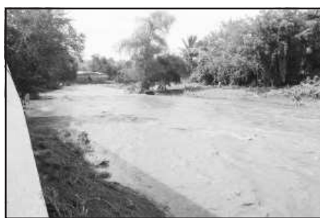
Tormentas eléctricas, fuertes aguaceros y lluvias persistentes, durante varios días con sus noches por el fenómeno natural de la acumulación de nubosidad desde países centroamericanos que ha cubierto la mitad del territorio mexicano que según el Servicio Meteorológico Nacional se prolongará durante 50 días más al finalizar el mes de septiembre.