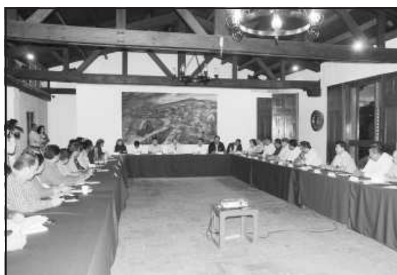
Funcionarios de todas las dependencias de la administración estatal, acompañaron al Gobernador Leonel Godoy Rangel, pidiéndoles a los presidentes municipales que se coordinen con cada uno de ellos para la aplicación de los programas en beneficio de la sociedad.