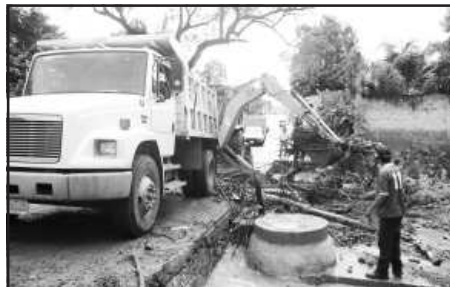
La acumulación de ramas, troncos y desperdicios de basura que se acumularon en vados, ocasionó también que el agua buscara salida hacia las calles que las convirtió en ríos.