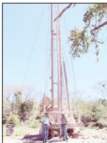
En la comunidad El Carrizal, se trabaja en la perforación de un pozo profundo para dotar de agua en sus hogares, y para aumentar el caudal a los habitantes de la tenencia Paso de Núñez.

Así mismo, el edil caracua-reense aprovechó la ocasión para trasladarse a la comunidad del Zapote de Coendeo, donde se está construyendo una presa e inspeccionar el avance que presenta, aunque se ha retrasado un poco la obra, el alcalde de Carácuaro se mostró muy optimista, ya que durante la supervisión quedó convencido con la forma en que está siendo construida, dicha presa presenta un avance de poco más del 70% de construcción.