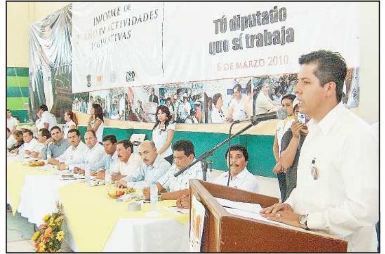
El diputado Antonio García Conejo, dio a conocer pormenorizado informe de sus actividades legislativas y de gestoría como representante popular ante el Congreso del Estado, representando al XVIII Distrito Electoral con cabecera en esta ciudad de Huetamo, ante más de dos mil personas.

En la Comisión de Justicia, dijo, en materia de dictamen se dieron atención a 17 documentos legislativos relativos a la materia familiar, civil, notarial, judicial y procedimental, así como dos procedimientos de juicio político, entre otros; como los relativos a la ratificación de reforma del artículo 73, fracción XXI, de la Constitución Política de los