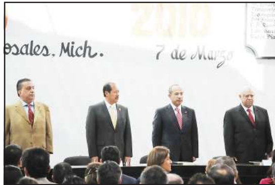
El Presidente de la República, Felipe Calderón Hinojosa y el gobernador Leonel Godoy Rangel, acompañados por los titulares de los poderes Legislativo y Judicial a nivel federal y estatal, presidieron el acto conmemorativo de la creación del Primer Supremo Tribunal de Justicia de la Nación.

Mencionó que a los mexicanos de hoy corresponde el deber y el reto de preservar la