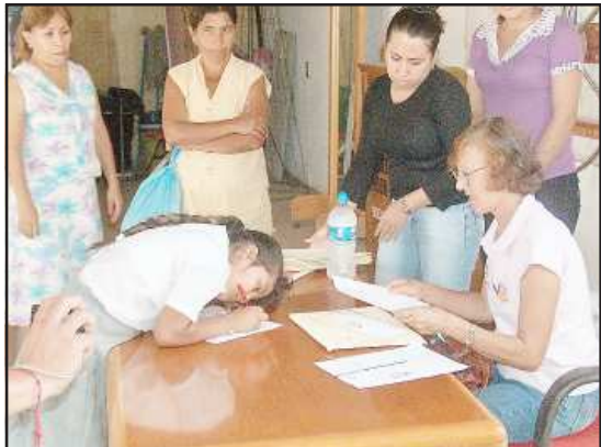
A niñas y niños de escasos recursos les fueron entregadas sus becas, por parte del DIF Municipal de Huetamo, para que continúen sus estudios y en apoyo a su economía y la de sus familiares.

deben de obtener un promedio de calificación alto y de asistencia para poder continuar recibiendo este apoyo.