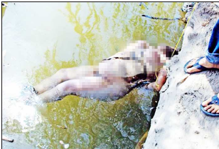
El jueves antepasado desapareció esta mujer y su cuerpo fue encontrado en estado de descomposición la tarde del domingo, sin señales de tortura y sin que se conozca su identidad.

El agente del Ministerio Público investigador de Huetamo en turno, quien dio fe del levantamiento del cadáver, confirmó que la mujer no presentaba huellas de violencia o heridas de algún arma, sólo que estaba amarrada de las manos y con su propio pantalón la sujetaron de los pies.