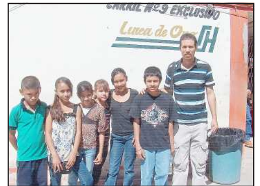
Alumnos de de distintas escuelas primarias representaron al municipio de Huetamo, en el Selectivo Estatal de Atletismo en 75 metros y 300 metros de relevo, para calificar a la fase nacional. ida y vuelta, ya que la mayoría de los niños no cuentan con recursos suficientes para el transporte.

El profesor agradeció a todos los que ayudaron para que estos niños fueran a participar, como Línea de Oro San Huetamo, que les ayudó con el 50 por ciento de descuento en los pasajes de