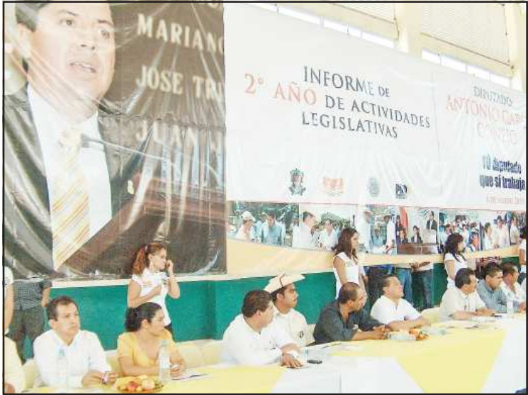
Personalidades del ámbito político y de los diferentes sectores sociales del XVIII Distrito Electoral de Huetamo, acompañaron al diputado Antonio García Conejo, durante su Segundo Informe de labores legislativas.

El diputado local, Antonio García Conejo, se comprometió ante más de 2 mil personas que se dieron cita a su Segundo Informe de actividades legislativas, a concretar en la Comisión de Asuntos Migratorios la creación de la Ley de Derechos y Políticas Públicas del Migrante del Estado de Michoacán, el fortalecimiento e incentivación de participación política de los migrantes michoacanos con el voto en el extranjero con reformas al Código Electoral del Estado de Michoacán, entre otros.