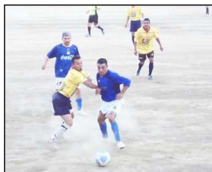
En el municipio de Carácuaro, fue inaugurado el Torneo Regional de Fútbol en el campo municipal, con el encuentro entre los equipos de la Colonia contra San Antonio de las Huertas, quedando empatados a un gol, al mismo tiempo de que las autoridades municipales entregaron balones a cada uno de los equipos participantes.