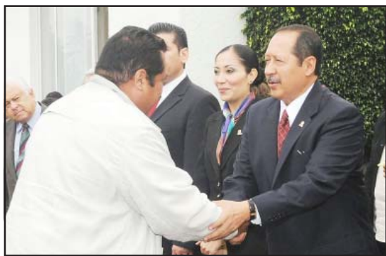
El Gobernador del Estado, Leonel Godoy Rangel, entregó al presidente municipal de Huetamo, Roberto García Sierra, las llaves y documentación de la camioneta que donó el gobierno estatal, para ser puesta al servicio de la Policía Municipal, para el resguardo, seguridad y paz social de los habitantes del municipio.

La administración estatal adquirió 112 patrullas nuevas para apoyar el trabajo de las Policías Municipales, con una inversión de 26.7 millones de pesos. Es la segunda entrega de patrullas que realiza la actual administración a los diversos municipios.