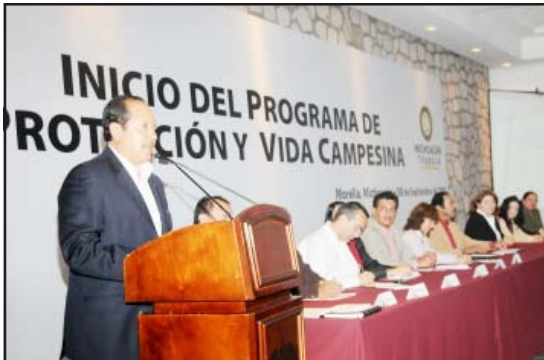
El Gobernador del Estado, Leonel Godoy Rangel, al poner en marcha el programa "Fondo de Protección y Vida Campesina", señaló que su gobierno apoyará a los trabajadores del campo con 25 mil pesos en caso de deceso del sostén de la familia, disponiendo de un fondo de 10 millones.

Morelia, Mich., Septiembre de 2009.- El Gobernador Leonel Godoy Rangel puso en marcha el programa "Fondo de Protección y Vida Campesina" con el cual se apoyará a trabajadores del campo con 25 mil pesos en caso del deceso del sostén familiar. El esquema arranca con recursos por 10 millones de pesos y la meta es inscribir, en lo que resta del año, 50 mil beneficiarios.