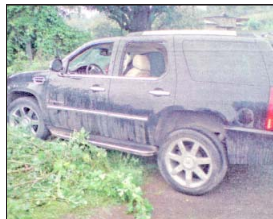
Así quedó la camioneta que conducía.

El agente del Ministerio Público que se constituyó en el lugar donde estaban los cadáveres, asentó que la ejecución ocurrió al filo de las 19:30 de este martes, al parecer desde un vehículo en movimiento desde donde dispararon y después huyeron de la escena con rumbo desconocido.