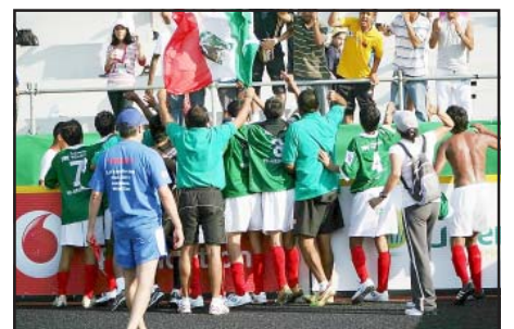
Los futbolistas michoacanos con la selección nacional, siguen cosechando triunfos, al pasar a la etapa de cuartos de final del campeonato mundial que se está efectuando en Milán, Italia.