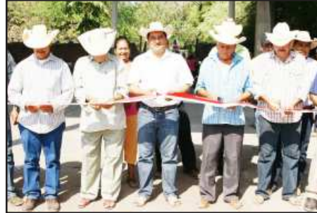
Eventos deportivos, culturales y sociales, podrán efectuar los habitantes de la comunidad La Estancia Grande y de lugares cercanos bajo techo que los protegerá de los rayos solares y lluvia, obra que realizó el gobierno municipal de Nocupétaro y que inauguró el presidente de la comuna, Francisco Villa Guerrero.

Con esta herramienta el gobierno federal, estatal y municipal, utiliza para la asignación de recursos, así como la programación de obras y servicios a la población, también se sabe si somos más pobres o más ricos, por eso es muy importante la participación de la ciudadanía y se dejen entrevistar, es muy importante también responder objetivamente.