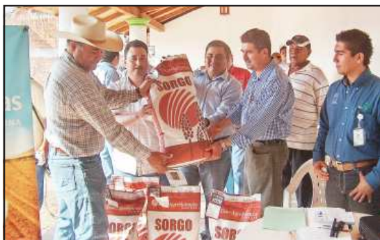
Mostraron gran interés los campesinos por la nueva semilla de sorgo que de inmediato adquirieron para aplicarlo en sus parcelas.