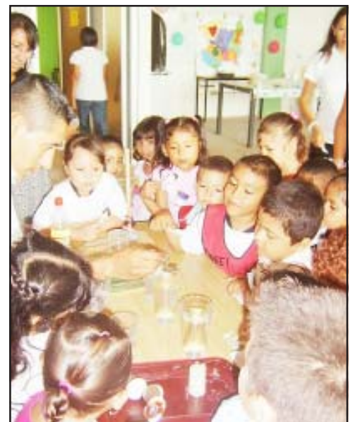
Decenas de chiquitines presenciaron algunos de los avances que la ciencia y tecnología pone al servicio de la humanidad para su bienestar y progreso.

Los diferentes stands prepararon reactivos en donde se estimuló las áreas del conocimiento, empleando métodos actualizados y la computación, para prepararlos para su inserción a un mundo altamente tecnológico. De esta forma participaron todos los alumnos de preescolar de Huetamo y sus alrededores, en un ambiente agradable y de satisfacción.