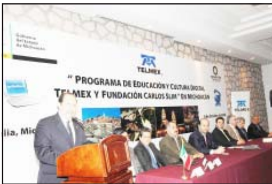
Leonel Godoy Rangel y Carlos Slim Seade, testimoniaron la entrega de más de 2 mil computadoras donadas por la fundación Carlos Slim, del programa Educación y Cultura Digital de Telmex, para 166 escuelas de siete municipios.