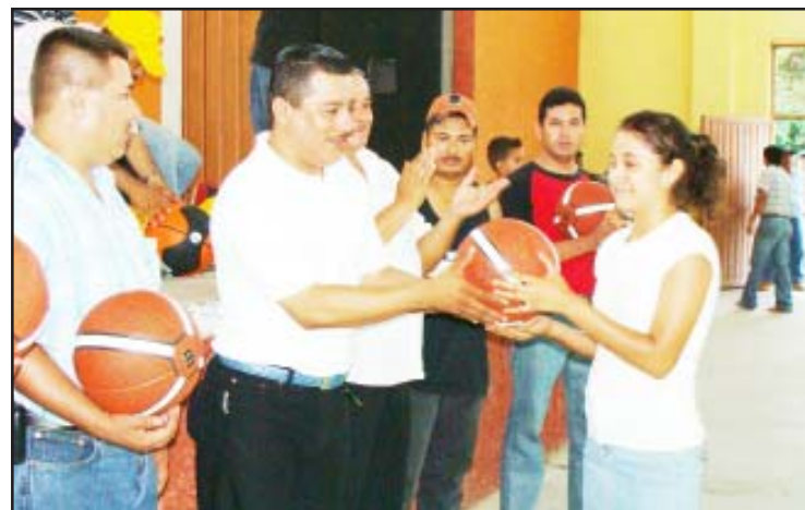
Momentos en que el gobernante nocupetareño entrega balones a cada uno de los equipos participantes en el Torneo Regional de Básquetbol, que culminará el 31 de octubre, dentro del marco de las tradicionales fiestas anuales en esa población.