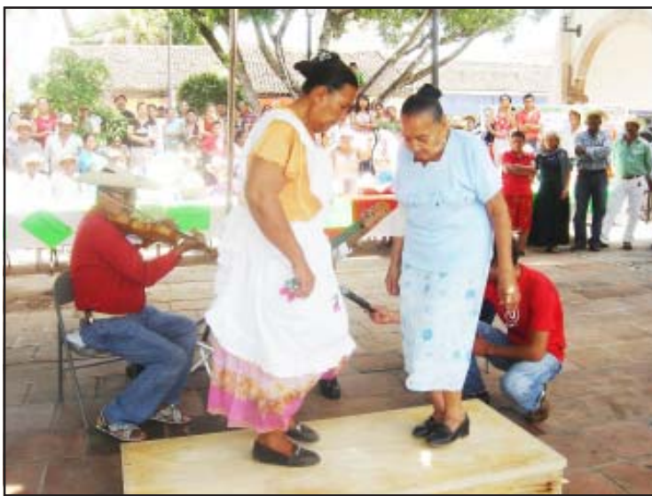
Grata participación de los asistentes al evento, fueron los bailables de personas de las diferentes edades quienes al compás de la música de tamborita de los hermanos Valdez de la Tenencia de Purechicho, demostraron sus habilidades de bailes de la Tierra Caliente michoacana.

De San Lucas asistieron CODECOS de La Lajita, Corral Viejo, Los Brasiles, Las Huitzúcatas, El Barrio de las Flores, Monte Grande, Querutzeo y El