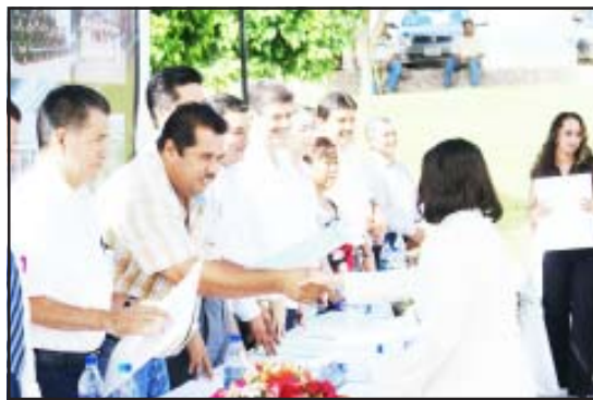
Con motivo de la celebración del séptimo aniversario de la fundación del Instituto Tecnológico Superior de Huetamo, se entregaron cédulas profesionales, a diez egresados, a trabajadores por cinco años de prestar sus servicios a la institución y reconocimientos a profesores por su excelente desempeño al servicio de sus alumnos.