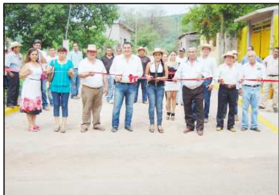
También el presidente Mario Reyes Tavera, inauguró la casa de descanso del panteón y el techo del Mercado Municipal, entre otras obras.

La pavimentación de concreto hidráulico de las calles Juan Escutia, Othon Villela, Cándido Ramírez y Calzada del Panteón dan una mejor vista a la infraestructura del pueblo, puesto que son algunas calles céntricas; además ayudan con la vialidad de los vehículos y personas que transitan diariamente por esos espacios en los que se invirtieron 190 mil 68 pesos, para la calle Juan Escutia que lleva a las instalaciones de la máxima casa de estudios del municipio, en donde cada semana acuden jóvenes alumnos a sus clases diarias; la calle Othon Villela que desde uno de los extremos del pueblo llega hasta la plaza principal, en donde diariamente se tiene transcurso peatonal y vehicular tiene una inversión de 530 mil pesos;