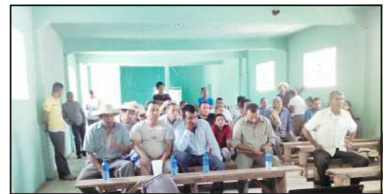
Aspecto de los asistentes.

Las demostraciones y trabajos presentados han sido promovidos gracias a la organización denominada “Mexchicana”, que busca el desarrollo potencial de las comunidades del país, y que pueden lograrse como consecuencia de visión, esfuerzos y determinación; el municipio de Tiquicheo se encuentra listo para recibir mejores oportunidades.