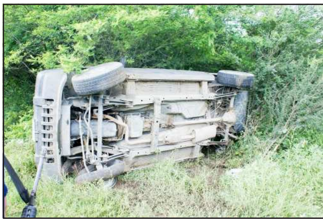
Con lesiones leves resultaron los conductores y tripulantes de dos camionetas que se impactaron en la carretera que conduce de Huetamo a Ciudad Altamirano, en tramo conocido como la recta de los Limones.