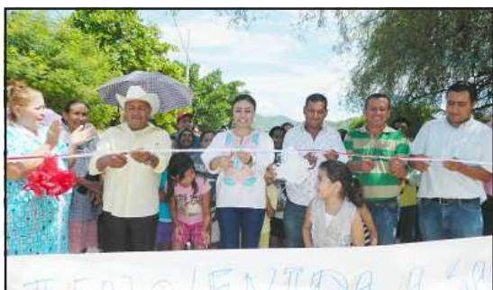
Un vado de pavimento hidráulico, pavimentación de calles, entre otras obras, entregó la presidenta Dalia Santana Pineda, durante su gira de trabajo por varias comunidades y la tenencia de San Jerónimo.

El gobierno municipal que preside Dalia Santana Pineda, cumple a favor del bienestar de los ciudadanos, haciendo entrega de 4 nuevas obras que beneficiarán a las comunidades de Quetzería, Santa Rosa y San Jerónimo; en un recorrido dirigido principalmente a la inauguración de estas obras, la primer comunidad en ser partícipe del corte de listón fue Quetzería, donde se benefició a los pobladores de ese lugar con un vado de pavimento hidráulico