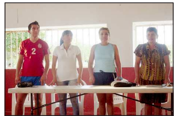
Directivos de la Liga Municipal de Volibol.

Los seguimos invitando a que asistan al Auditorio Municipal a disfrutar, de estos encuentros deportivos, por el momento es todo lo que su amigo Voliboleando les comenta como siempre recordándoles has el bien sin ver a quién, que Dios los bendiga y hasta la próxima.