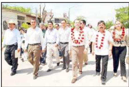
Posteriormente el gobernador Zeferino Torreblanca Galindo, inauguró la pavimentación de la calle Miguel Hidalgo y Costilla y la nueva Comandancia de la Policía Municipal, en compañía del presidente municipal de Pungarabato, Gustavo Adolfo Juanchi Quiñones.

Ahí el alcalde de Pungarabato, Gustavo Adolfo Juanchi Quiñones a nombre del cabildo, entregó al gobernador Zeferino Torreblanca un reconocimiento por el apoyo brindado para mejorar la imagen del municipio y de la Tierra Caliente.