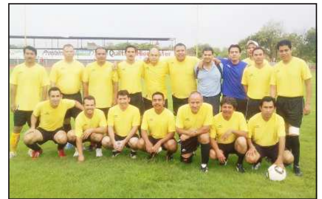
Los trabajadores de la máxima casa de estudios de la región, también obtuvieron excelentes resultados durante la jornada deportiva desarrollada en Apatzingán.

Y en basquetbol femenino, Huetamo-Pátzcuaro, Huetamo-UTM y semifinal Huetamo-Coahuila, en la cual se ganaron los dos primeros. En la rama varonil, Huetamo-Pátzcuaro y Huetamo-Apatzingán, con uno ganado y uno perdido.