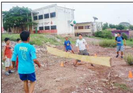
Los niños juegan en un lugar inadecuado.

Niños y jovencitos de la colonia El Toreo que gustan de practicar el fútbol a espaldas del Auditorio Municipal, entrenan y practican su deporte a diario entre hierbas y escombros, con la esperanza de que a la brevedad, se cristalice la ilusión de que las autoridades municipales construyan una cancha contigua al Auditorio Municipal, solicitud que les fue entregada por padres de familia y vecinos.