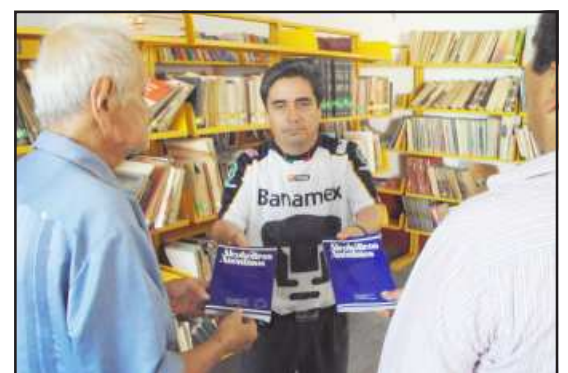
La Central Mexicana de Servicios Generales de Alcohólicos Anónimos de Huetamo, entregaron un paquete de libros a la Biblioteca Pública Municipal, con información de su organismo.

Es importante comentar que estos libros, contienen información vital acerca del problema del alcoholismo y sus consecuencias, así como el método de recuperación y experiencias personales de individuos que han logrado la sobriedad perma-