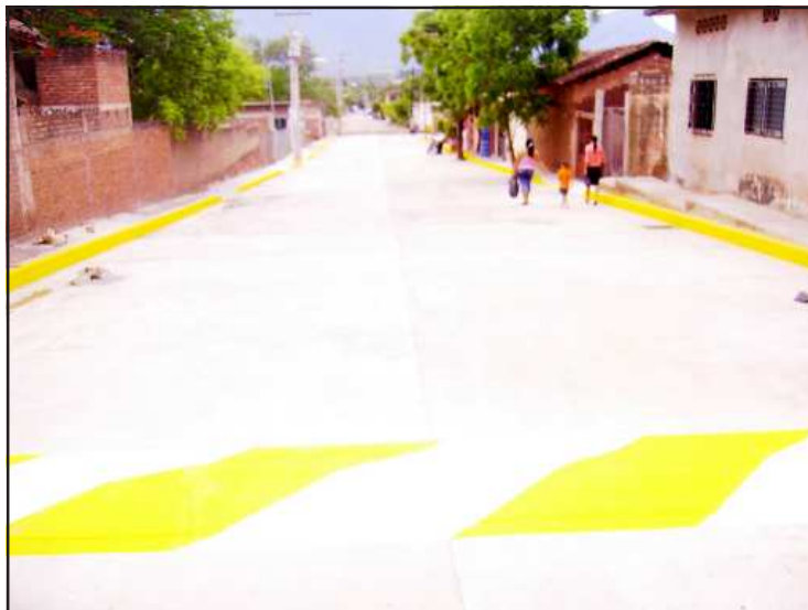
La calle Sóstenes Rocha de la colonia Barrio de Dolores, así luce ahora, después de su pavimentación que realizó el ayuntamiento a petición de los habitantes de esta importante calle.

nias y barrios de Huetamo tendrán obras y beneficios, pues ninguna se quedará exenta de éstas.