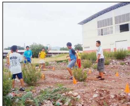
El terreno se encuentra en pésimas condiciones.

Si su negocio lo anuncia en las páginas de