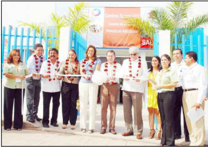
Margarita Zavala, presidenta del Consejo Ciudadano Consultivo del Sistema Nacional DIF y el gobernador del Estado de Guerrero, Zeferino Torreblanca Galindo, inauguraron la unidad de rehabilitación Centro Nueva Vida, acompañándolos miembros del cabildo y funcionarios estatales y municipales.