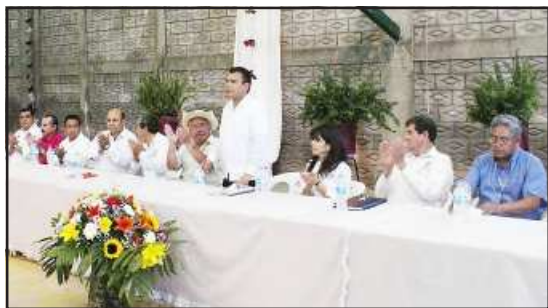
Fidel Calderón Torreblanca, secretario de Gobierno, presidió la ceremonia como testigo de honor durante la entrega del Decreto Oficial de Reserva Ecológica de la Mesa de Tzitzio a las autoridades municipales.

Celebró la recuperación del patrimonio comunal municipal de la Mesa de Tzitzio, un patrimonio natural propiedad de la humanidad, pero sobre todo de los michoacanos, los felicitó por el trabajo conjunto de este trámite administrativo que representa