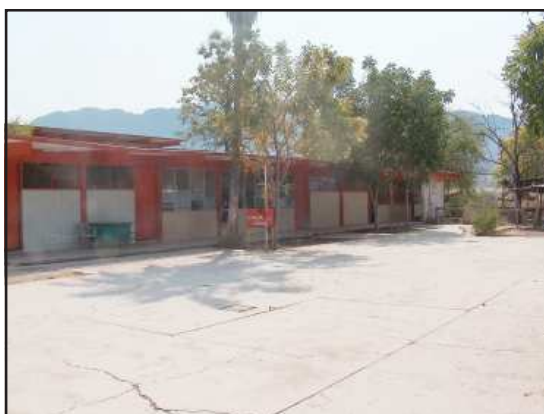
Se trabaja en la impermeabilización.

El entrevistado subrayó el avance de preparación del nivel académico y en la infraestructura para recibir a los aspirantes a ingresar al nivel medio superior. Agregó que se están impartiendo cursos psicopedagógicos a docentes de Nocupétaro, Tiquicheo y Huetamo. En relación a la infraestructura del plantel hasta el momento se tiene un avance de un