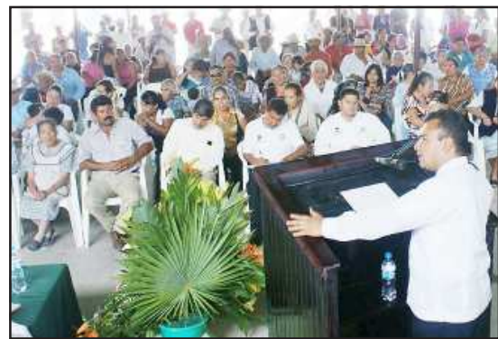
El secretario de Gobierno Fidel Calderón Torreblanca, manifestó su beneplácito por la recuperación del patrimonio comunal municipal de La Mesa de Tzitzio, después de una larga lucha jurídica por décadas.

“Ese fue el motivo del trabajo coordinado, sin embargo aún se necesita mucho para detonar el potencial, no sólo de producción de agua sino de una gran riqueza ambiental que pone a este predio con un gran oportunidad para desarrollar proyectos turísticos que mejorarán las condiciones de vida de los habitantes del municipio, en donde se tenga oportunidad de empleo”, indicó.