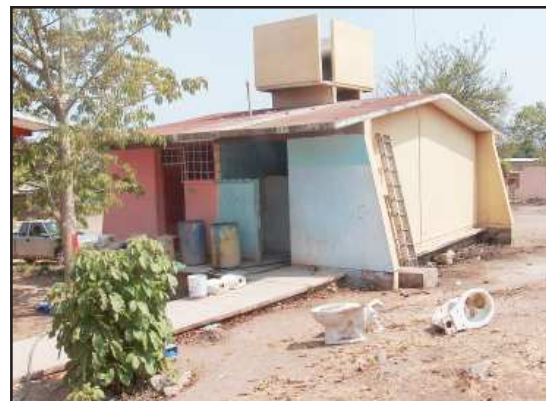
Se reacondicionan los sanitarios.

Añadió que también se están reforestando las áreas verdes, en