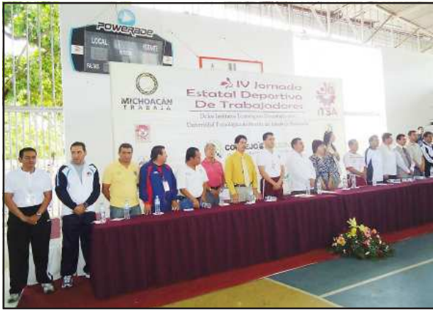
Autoridades de la Secretaría de Educación en el Estado, inauguraron la IV Jornada Estatal Deportiva de Trabajadores de los Institutos Tecnológicos Descentralizados, en la ciudad de Apatzingán.

El Instituto Tecnológico Superior de Huetamo, participó en la "IV Jornada Estatal Deportiva de Trabajadores de los Institutos Tecnológicos Descentralizados", los pasados días 1, 2 y 3 de julio del 2010 en la ciudad de Apatzingán.