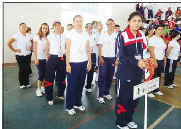
Los equipos femeniles del Tecnológico de Huetamo, dieron muestra de sus cualidades deportivas al enfrentarse con sus similares de Coahuila, Uruapan, Tacámbaro, Pátzcuaro, Zamora, Purépecha, Los Reyes, Puruándiro, Ciudad Hidalgo y Apatzingán.

Así mismo tuvimos nuestra representante en el concurso de belleza Señorita Tecnológico, a Marine-