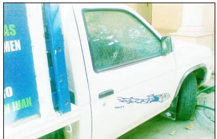
Esta es la camioneta “pasajera” en donde perdió la vida una anciana al tratar de ser asaltada, en el camino que comunica a la población de Tierras Blancas a Santa María, pertenecientes a este municipio.

Del crimen tuvo conocimiento el Agente del Ministerio Público de turno, quien ordenó que el cadáver fuera trasladado al Servicio Médico Forense para la necropsia de ley e integrar la averiguación previa penal número 07/2009-II, en contra de quien resulte responsable de homicidio y lesiones.