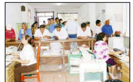
Decenas de personas han acudido en este comienzo del año, a la Administración de Rentas de esta ciudad, para realizar diversos trámites fiscales.