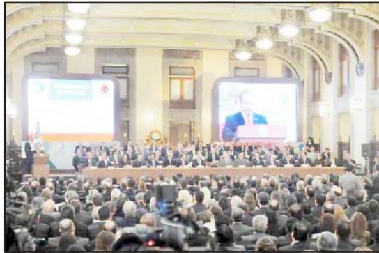
El presidente Felipe Calderón, presentó el Acuerdo Nacional en Favor de la Economía Familiar y el Empleo, evento al que asistió el Gobernador del Estado, Leonel Godoy Rangel, en donde anunció que se congelarán los precios de la gasolina en todo el país durante este año, así como del gas LP, y se comprometió a dar apoyos para que los ciudadanos puedan renovar sus electrodomésticos, por aparatos modernos que ahorren energía, así como ampliar los servicios del IMSS para personas desempleadas.

□ Leonel Godoy Rangel, asistió a la presentación del Acuerdo Nacional a Favor de la Economía Familiar y el Empleo.