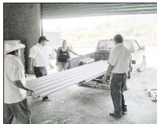
Fueron 44 familias las que resultaron beneficiadas con la entrega de paquetes de láminas para techo de sus viviendas que les proporcionó el gobierno municipal de Huetamo a un precio simbólico.

A nombre de los beneficiarios, una madre de familia agradeció la ayuda brindada por el gobierno huetamense, que nunca los ha abandonado la actual administración municipal, dijo.