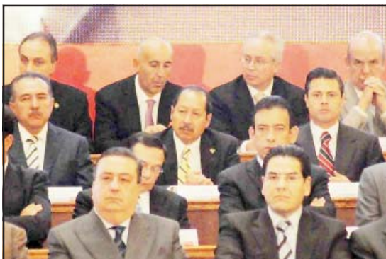
El Gobernador del Estado, Leonel Godoy Rangel, expuso durante la firma del Acuerdo Nacional en Favor de la Economía Familiar y el Empleo, que en Michoacán se están planeando tácticas que serán implementadas dentro del Plan Estratégico Anticrisis en esta entidad, mismas que se verán fortalecidas con las 25 acciones que presentó el presidente de la República a nivel nacional. Como parte de esas estrategias se encuentra la inversión en obras de infraestructura, destinadas principalmente a los sectores de cultura, educación, salud, medio ambiente y deporte.

También se tiene programado trabajar en la presa Francisco J. Mújica y otra más en la costa o en Tumbiscatío y que durante el 2009, ya estén funcionando plenamente los nueve hospitales, así como los cuatro CERESOS, entre ellos el que se iniciará a construir este mes en Tacámbaro.