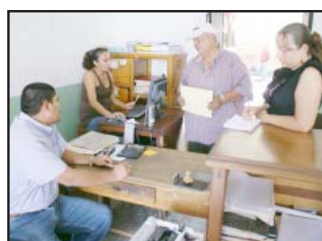
Durante 6 horas diarias de lunes a viernes reciben atención las personas que acuden a pagar su impuesto predial anual.

Por otro lado, se tiene un rezago del año pasado del 50 por ciento en el padrón de inmuebles urbanos y de un 79 en rústicos, con lo que se puede observar un mayor cumplimiento en sus obligaciones fiscales la ciudadanía de la zona rural del municipio, destacó el director de Catastro Municipal.