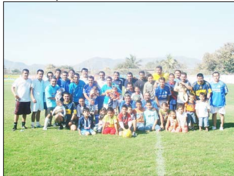
En el mes de diciembre deportistas de la colonia El Toreo, organizaron un encuentro deportivo amistoso, participando jugadores de antaño, actuales y futuras promesas, esperamos sigan haciendo este tipo de partidos, donde además de fomentar el deporte en su colonia, y también avivan la unión y hermandad entre amigos, ¡enhorabuena!

policías municipales de la región, desertando el equipo de Músicos por causas desconocidas, de lo que corresponde a la actividad en la edad libre, ayer en un encuentro entretenido Tomatlán, recibió a Independiente que es líder de esta competencia en la edad libre; hoy en la categoría Veteranos, 2 equipos y grandes rivales se enfrentarán para juntar fuerzas como Ayuntamiento e Independiente, los detalles en nuestra próxima edición.