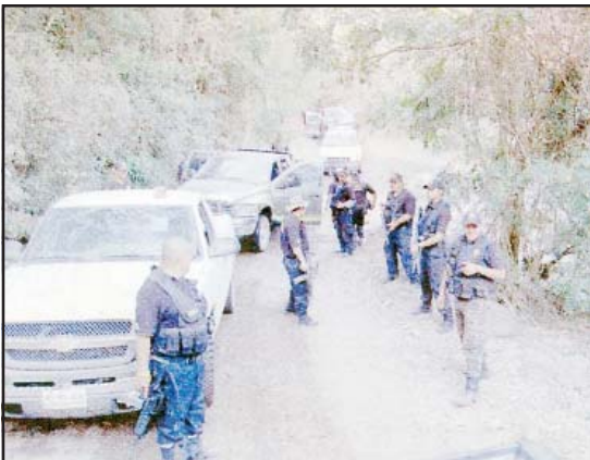
Elementos policíacos federales y estatales recorren caminos y veredas del municipio de Tiquicheo, así como en viviendas de los ranchos en busca del peligroso asesino.

Diferentes corporaciones policíacas y ejército rastrean su paradero