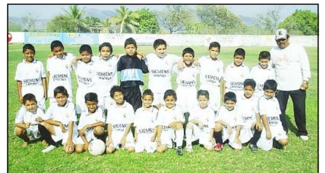
El equipo Chapala de la categoría Pony de hace algún tiempo, algunos de ellos son hoy juveniles y otros infantiles, le estarán diciendo adiós a su equipo para emigrar a otro club por la falta de seriedad por parte de su entrenador, esperemos que se despidan levantando el campeonato.

19:00 horas en la tienda de "Deportes Marlon-Axel". Hoy en el campo empastado de la categoría Infantil a las 8:30 horas por fin se jugará la final de la categoría Infantil entre los equipos de Chapala y Tariácuri, después de varias semanas en conflicto ya que el equipo que dirige el legendario "Bora", este personaje que bastante se le ha estimado por su larga trayectoria como entrenador, ahora ha dado mucho qué decir pues tenía deuda con la liga, motivo por el cual no se le programaba, situación que los padres de familia algunos se encuentran moles-