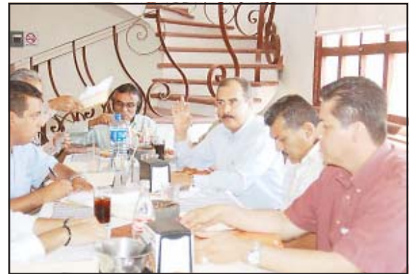
El diputado Antonio García Conejo, presidente de la Comisión Legislativa para Asuntos Migratorios, anunció el cambio de fecha para la realización del Foro Consultivo Migratorio.

Los diputados comentaron que dicho evento será un espacio de diálogo y acercamiento con migrantes, académicos, legisladores y ciudadanía en general, para discutir y generar opciones de política pública para con los connacionales y sus familias, y aterrizarlos en proyectos parlamentarios innovadores y programas gubernamentales, creando un nuevo marco jurídico que beneficie a este sector.