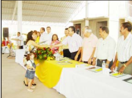
Por haber logrado el nivel aprobatorio superior durante los Exámenes Nacionales para Maestros en Servicio que aplicó la Secretaría de Educación, aquí en Huetamo, 20 maestros y maestras les fueron entregados reconocimientos por su esfuerzo realizado durante sus estudios de actualización.