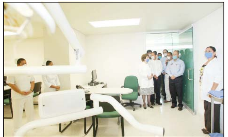
En la ciudad de Zamora, el jefe del Ejecutivo Federal, hizo un recorrido por las instalaciones hospitalarias de la Unidad Médica Familiar, donde conoció el equipamiento médico y sus instalaciones del inmueble.

“Nos vamos a tomar unas buenas carnitas no con otro