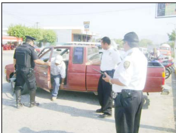
Importante operativo de Prevención del Delito, realizaron elementos policíacos estatales por diferentes rumbos de los municipios de Tiquicheo y Huetamo, con resultados positivos para tranquilidad de la ciudadanía.

Por otra parte, en la comunidad de San Jerónimo, municipio de Huetamo, se localizó y aseguró un vehículo de la marca Nissan, tipo Estacas, color rojo, que se encontraba abandonado sobre una brecha, el cual al ser examinado se encontró con reporte de robo en el Distrito Federal, delito del cual se integró la Averiguación Previa Penal número CRV/044/0532099-99, el cual fue puesto a disposición del agente del Ministerio Público en turno del Distrito Judicial correspondiente.