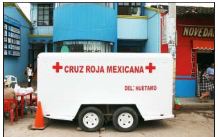
Este es el consultorio médico móvil, frente al edificio donde se encuentran las oficinas de la Administración de Rentas de Huetamo, donde ya está prestando sus servicios, bajo los auspicios del Patronato de la Benemérita Cruz Roja de Huetamo.

Además explicó para finalizar, que están contando con los apoyos para el funcionamiento de este consultorio médico sobre ruedas, de la Administración de Rentas de Huetamo, las autoridades de Tránsito locales y las autoridades municipales, a quienes se les agradece su amable comprensión para los propósitos que fue creado este servicio de utilidad pública.