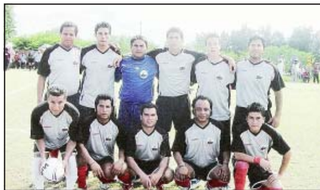
El equipo Halcones del Imperio del Estado de México, que año con año visita estas tierras, estará participando por 38ª ocasión en el cuadrangular de fútbol que se organiza en la tenencia de Purechucho.

A 2 fechas que se termine la jornada regular del torneo, será muy cerrado y se espera que todo salga bien, buena decisión de la liga para que concluyan las jornadas