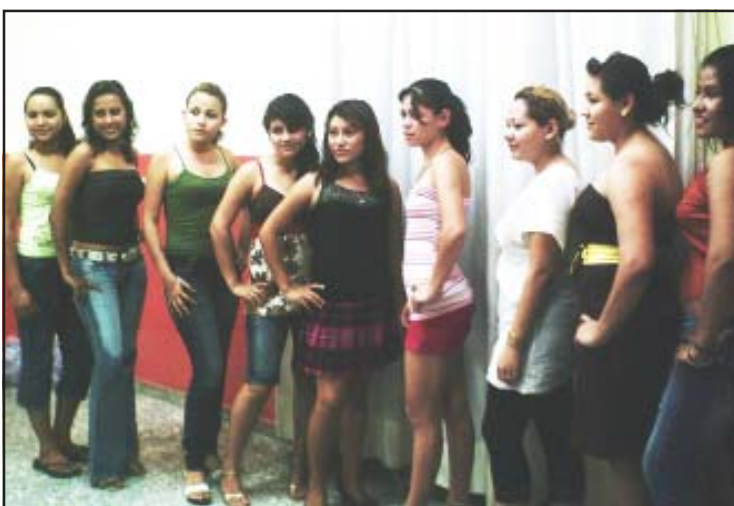
Este es el ramillete de encantadoras y bellas señoritas huetamenses que participarán en el concurso para elegir a tres de ellas que participarán en varias festividades.

Frente a ese escenario, se pretende conservar las tradiciones y costumbres de nuestra ciudad, por lo que desde principios de mes se leyó y pegó el bando solemne y a lo largo del mes se anuncian varios eventos populares, desde culturales y deportivos, así como las gustadas corridas de toros a la vieja usanza, sin faltar los alegres bailes, las serpentinas y coronación de las reinas de belleza.