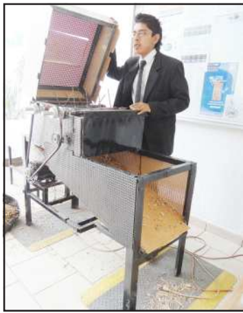
Estudiantes del Instituto Tecnológico Superior de Huetamo presentaron el proyecto de Trilladora Especializada para el Proceso Productivo del Cacahuete, para beneficio de los productores de cacahuete y el suyo propio.

De ahí se desprende la idea original de diseñar un equipo que realice la misma función de los demás en el mercado, a un bajo costo de producción y por ende, a un bajo costo de venta, lo que posicio-