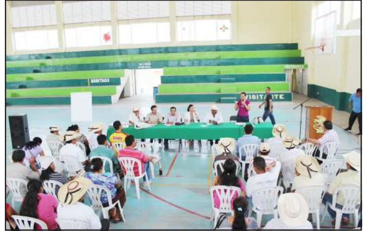
Para dar a conocer los diversos programas que ofrece el gobierno federal, a través de SAGARPA y ASTECA de Michoacán, se reunieron jefes de tenencia y encargados del orden, con las autoridades municipales, estatales y federales.

Finalmente informaron que con la implementación de este equipo dentro del proceso, se pretende alcanzar los siguientes objetivos: Reducir los tiempos de operación, los costos por mano de obra, aumentar la producción, reducir los desperdicios por daños en el fruto, aumentar la respuesta de los productores a la creciente demanda del producto y aumentar la competitividad de los campesinos, oriundos de la localidad de La Parota, municipio de Huetamo.