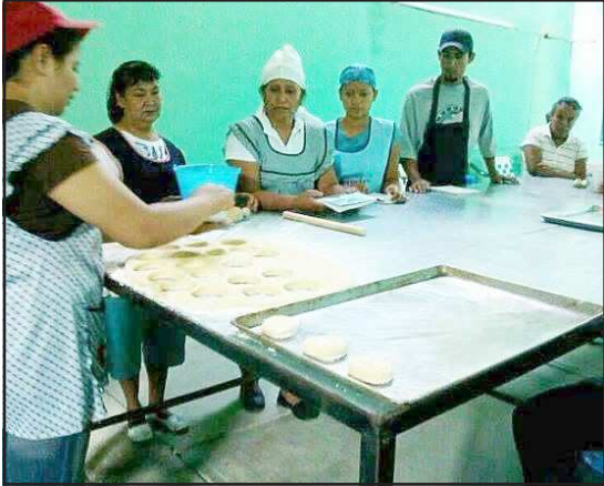
El Servicio Nacional del Empleo en Michoacán, se unirá a las acciones de la Cruzada Nacional Contra el Hambre, con cursos de panadería e industrialización de alimentos en Nocupétaro.