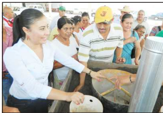
Amas de casa incluyendo la edil huetamense, aprendieron a elaborar una estufa "Lorena" y conocer su correcta funcionalidad de estos utensilios.