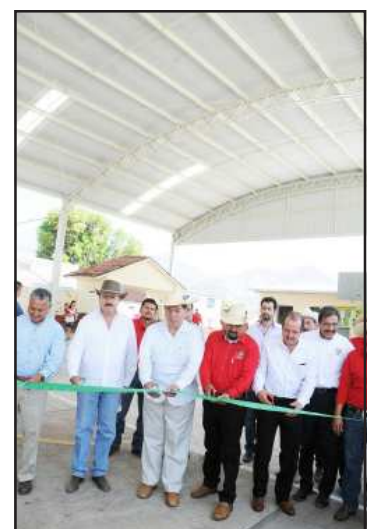
Durante su gira por el municipio de Tzitzio, el mandatario Jesús Reyna, señaló que el gobierno de Michoacán trabaja para que al cierre de la presente administración, no queden obras sin concluir.

Finalmente, el jefe del Ejecutivo Estatal dio a conocer que varios de los planteamientos que han hecho los habitantes del municipio de Tzitzio podrán atenderse por medio del Programa de Obra Convenida 2013, que se pondrá en marcha próximamente.