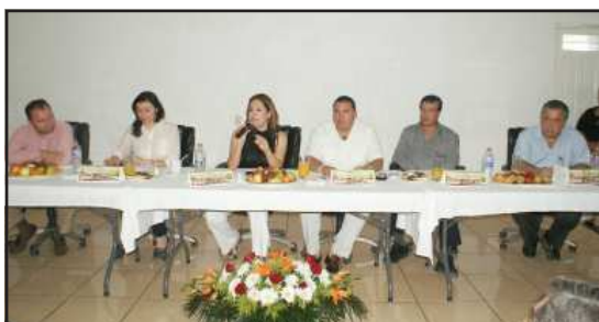
Los titulares de 4 secretarías del gobierno federal, se reunieron con los representantes de los sectores productivos y autoridades del municipio de Tiquicheo, para escuchar sus planteamientos.