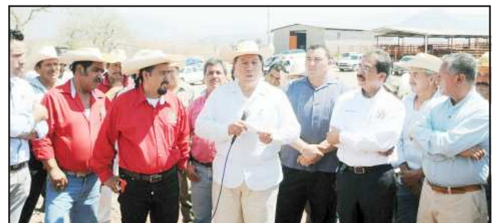
El gobierno federal autorizó para el ejercicio 2013, recursos por 20 millones de pesos para avanzar en la construcción de la carretera Tafetán-El Platanillo, anunció el Gobernador del Estado, Jesús Reyna García.

□ Se mejorará la comunicación entre los habitantes de la Tierra Caliente michoacana.