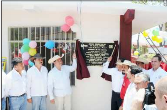
El Gobernador del Estado, Jesús Reyna García, realizó una gira por el municipio de Tzitzio, para inaugurar y supervisar obras en los rubros educativo, pecuario, deportivo y social, por una inversión de 30 millones de pesos.

□ Visita el mandatario el municipio de Tzitzio; inaugura obras de beneficio social y compromete su apoyo para gestionar recursos adicionales para acciones a favor de los habitantes de esa demarcación.