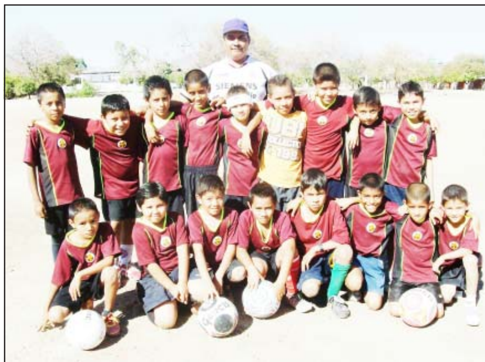
El equipo Escuela Zapata que participa en la Liga de Fútbol de Huetamo, categoría Sub 10, sumó su segunda victoria consecutiva, tras vencer a Ponysur el pasado viernes en la Unidad Deportiva Campo 2.