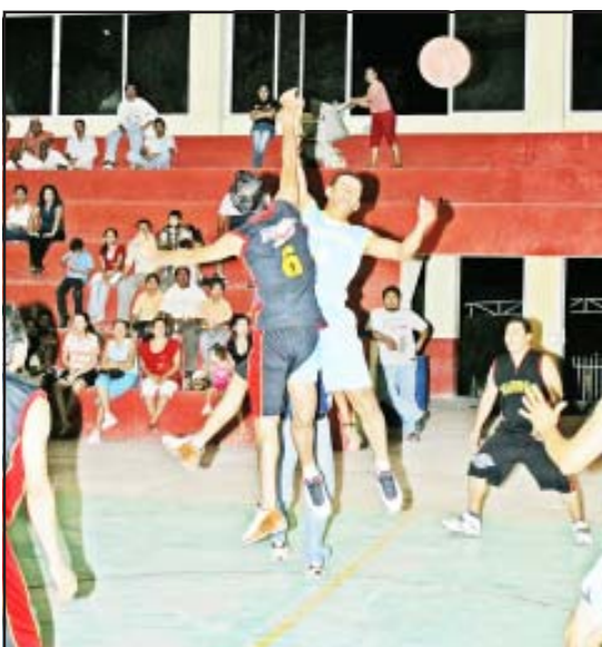
Encuentro lleno de emociones.