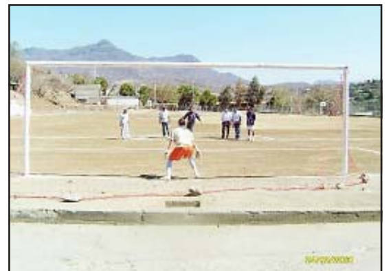
Con el marcador de 6 goles contra 2, la Selección Huetamo ganó a la Selección Carácuaro, durante el partido de inauguración.