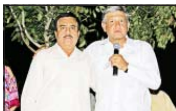
Tiquicheo, Huetamo y San Lucas, fueron las poblaciones que visitó Andrés Manuel López Obrador, para reunirse con sus compañeros de partido, el PRD, y sus simpatizantes, reiterándoles su invitación a no dejar privatizar PEMEX y le pidió al Presidente Felipe Calderón que informe a los mexicanos "cómo se han manejado los recursos provenientes del petróleo" y que el secretario de Gobernación, Juan Camilo Mouriño, haga pública su declaración patrimonial.