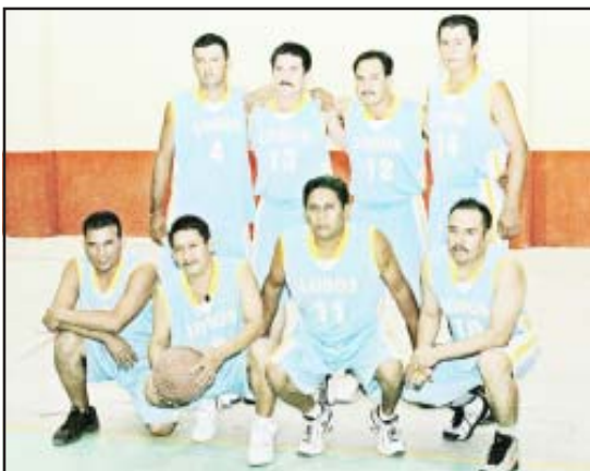
El equipo Los Lobos.

El equipo de básquetbol “Los Lobos”, resultó campeón del Torneo de Liga de 2007-2008, tras disputar la gran final ante la quinteta de “Guerreros”, evento organizado por la Liga Municipal del mismo deporte de Huetamo, la noche del pasado martes en el Auditorio Municipal de esta ciudad.