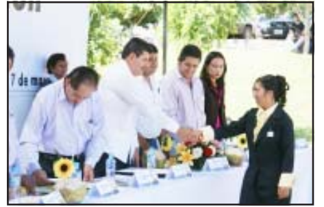
Con orgullo y gran satisfacción, veintidós alumnos del Instituto Tecnológico Superior de Huetamo, recibieron sus títulos y cédulas profesionales que los acreditan Ingenieros en Sistemas Computacionales, durante emotiva ceremonia en las instalaciones del propio plantel, ante los representantes del sector educativo del Estado.