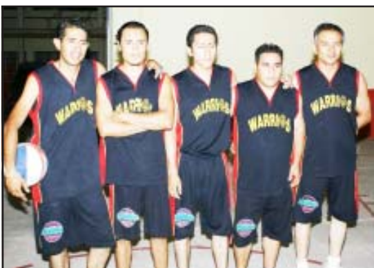
El equipo Los Guerreros.