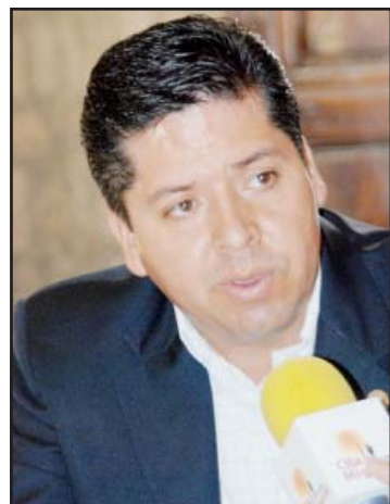
Lic. Antonio García Conejo, Diputado Local por el XVIII distrito electoral.

Finalmente, dijo, no se trata de un partido político contra otro, debe quedar claro que el respeto a los derechos humanos de la población está por encima de todo.