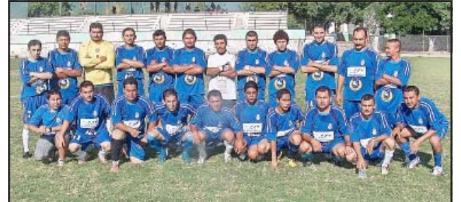
Tereo y Tomatlán, dos buenos equipos que tuvieron una de las mejores campañas en comparación a otros años, hoy están buscando el boleto a semifinales, uno contra Centro y el otro contra Dolores el actual campeón, ¡Suerte muchachos!

Después de que en anteriores torneos, se venía efectuando con posición de tabla general como premio para los mejores equipos que por su esfuerzo y dedicación durante la temporada regular lograban ubicarse, de buenas a primeras la liga decidió no respetarlo, según los directivos para que la liguilla se juegue más pareja y con las mismas oportunidades para todos los equipos; decisión que sin duda es de analizarse, ya que los mejores equipos como Tereo, Unidad, Colonias y Tomatlán, uno de ellos lo puede lamentar, por no hacer valer cierto derecho que les correspondía, gracias a su buena temporada donde pusieron todo su esfuerzo, dedicación y seriedad para lograr estar mejor ubicados, es por ello que esto generó una inconformidad de algunos jugadores que militan en los equipos mencionados, pues con justa razón externan su molestia considerando que le han dado poco valor a su esfuerzo.