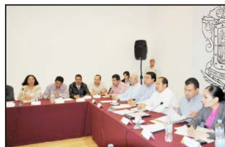
Los presidentes municipales y diputados priístas, así como el dirigente estatal de ese partido, se reunieron con el gobernador Leonel Godoy Rangel, con quien analizaron los problemas sociales y de finanzas de los ayuntamientos por la crisis económica y la preparación de los presupuestos para el año entrante que mejoren la administración pública estatal y municipal.