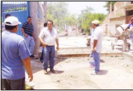
El presidente municipal de Huetamo, Roberto García Sierra, en sus habituales recorridos por las obras que se realizan por diversas partes del municipio, en su más reciente gira de trabajo, supervisó los avances de pavimentación de la calle Zicuirancha, en la colonia El Coco de esta ciudad, así como otras que se encuentran en proceso de terminación.