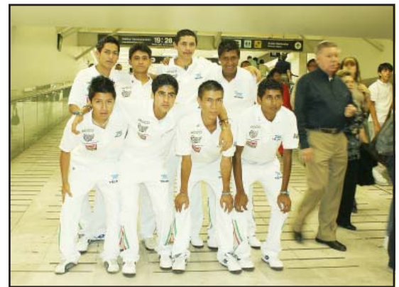
Los integrantes de la selección michoacana antes de abordar el avión que los conduciría a Milán, Italia, en donde participarán en el torneo de la Copa Mundial de Fútbol de Street Soccer.