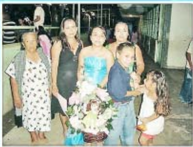
En la foto del recuerdo la graduada con su mamá, abuela, tía y hermano.