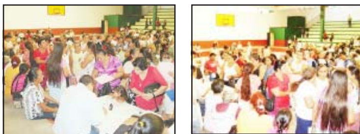
Amas de casa del municipio de Carácuaro recibieron apoyos económicos.

Dicho pago corresponde al bimestre de noviembre-diciembre del año 2007. Cabe mencionar que para cada bimestre se pretende buscar mayores ingresos y sean más los beneficiados con este programa.