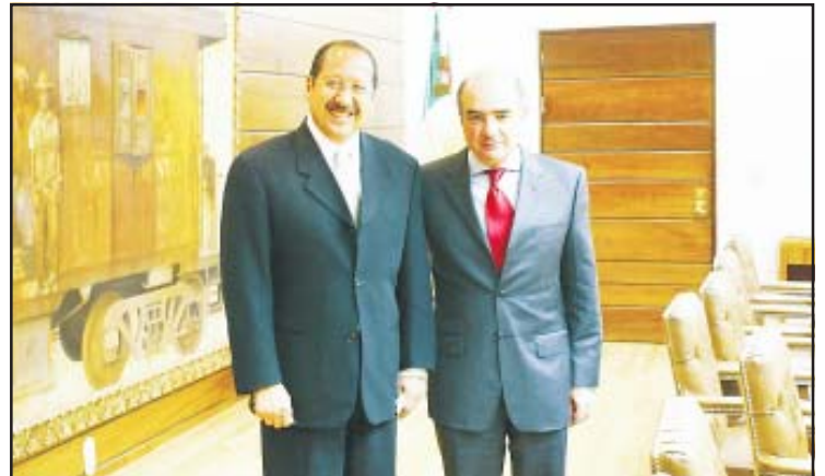
El gobernador Leonel Godoy Rangel en reunión de trabajo con el titular de la Secretaría de Comunicaciones y Transportes, Luis Téllez, se establecieron las bases para dotar a Michoacán de la infraestructura necesaria para su progreso.