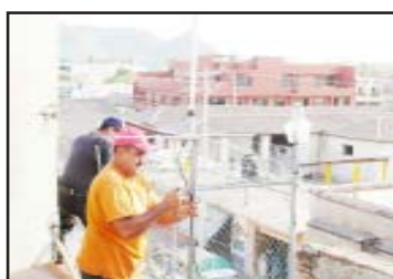
Para mejorar la nitidez en las comunicaciones radiales de la Policía Municipal Preventiva de Huetamo, se hicieron labores de mantenimiento y reparación de los equipos transmisores para brindar un mejor servicio a la ciudadanía.

bajo anual la instalación de una antena repetidora en el cerro de Turitzio, y así tener cobertura en todo el territo-