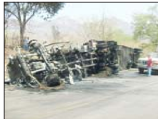
El trailer quedó reducido a cenizas, al igual que el melón que transportaba rumbo a Morelia, Mich.