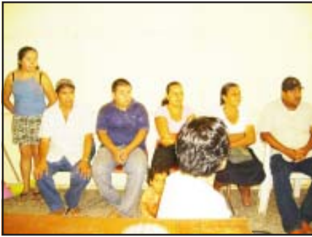
Reunión con vendedores de tacos por las noches.