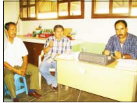
Por separado también con locatarios del mercado.