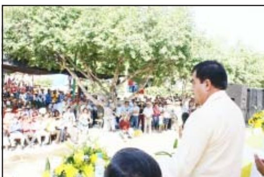
Servando Valle Maldonado, Presidente Municipal de San Lucas, al dirigir su mensaje a la ciudadanía.

verdaderamente necesiten la sociedad, manifestó Servando Valle, añadiendo que tocará las puertas que sean necesarias para traer obras al municipio.