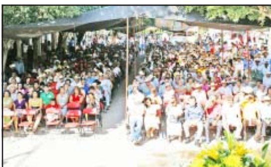
Asistentes a la toma de posesión.