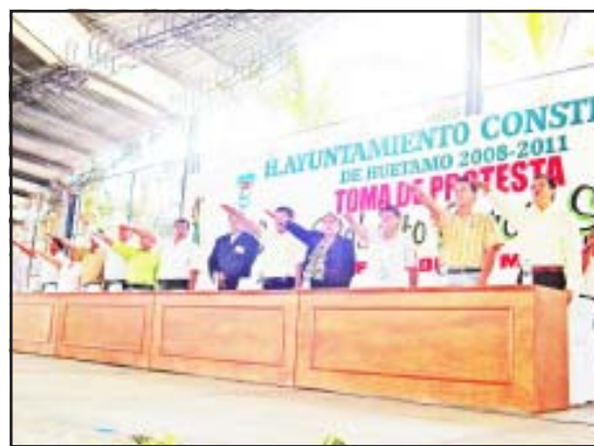
El Presidente Municipal, Roberto García Sierra, síndico procurador y regidores, rindieron la protesta de ley para hacerse cargo del Honorable Ayuntamiento durante los próximos cuatro años.

Por último, el nuevo Presidente Municipal de Huetamo, señaló que ha concluido el inédito proceso electoral del 11 de noviembre, prevaleciendo la voluntad popular, así mismo reiteró su trabajo para todos los huetamenses sin distinción alguno, pues sus acciones serán encaminadas a mejorar las condiciones de vida de todos los ciudadanos del municipio.