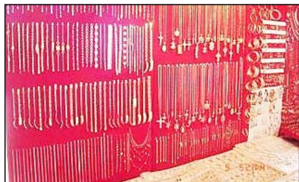
Para exponer a la venta las alhajas de oro como se muestra en la fotografía, las tablas envueltas en una franela roja le fue robada al salir de su domicilio a una vendedora que se dirigía al portal de esta ciudad donde se expenden.

Después de cometer el asalto, los hampones se dieron a la fuga con rumbo desconocido, mientras que los afectados se trasladaron a la comandancia de la Policía Municipal, para después los efectivos policíacos realizaron un intenso operativo en la zona de los hechos sin tener resultados positivos.