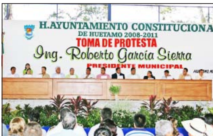
En sesión de Cabildo celebrada el día 1 de Enero del presente año, el nuevo Ayuntamiento de Huetamo tomó protesta para el periodo 2008-2011 ante cientos de ciudadanos.

En el apartado de obra pública, el nuevo presidente municipal informó