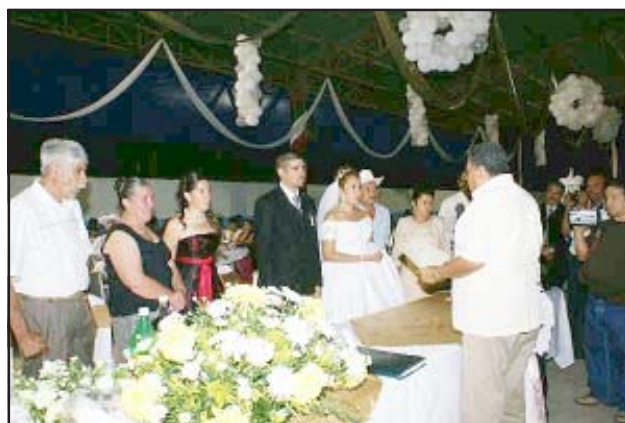
Después de la ceremonia religiosa, los novios se casaron ante el juez por lo civil.