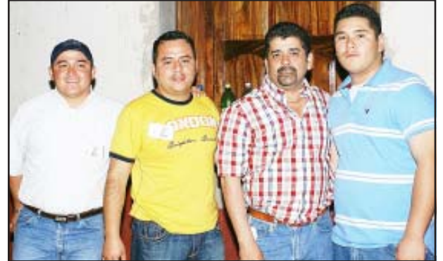
Saludos para nuestros amigos de Carácuaro y Nocupétaro.

no nos referimos al Día de Muertos, sino al Día de las Iguanas de Oro, que más bien serían iguanas de horror, pues este año estuvo tan pésimo el evento que incluso a los organizadores ya les dicen los Grinch, porque con su evento nada más vinieron a arruinar la Navidad, y de veras que nos consta eso, pues el evento estuvo de lo más chafa y al parecer ya se les está volviendo costumbre, porque el año pasado no cantó mal las rancheras, pero este año sí fue la gota que derramó el vaso y sobre todo, aparte del evento tan mal organizado fue todo un fraude en cuanto a los nominados y los ganadores pues nosotros paso a paso seguimos vía Internet los ganadores hasta unos minutos antes del evento y la neta tenemos que reconocer que la mitad de los ganadores fueron ciertos, pero con tristeza les informamos que la otra mitad fue todo un fraude pues los organizadores le dieron el gane a quien quisieron sin