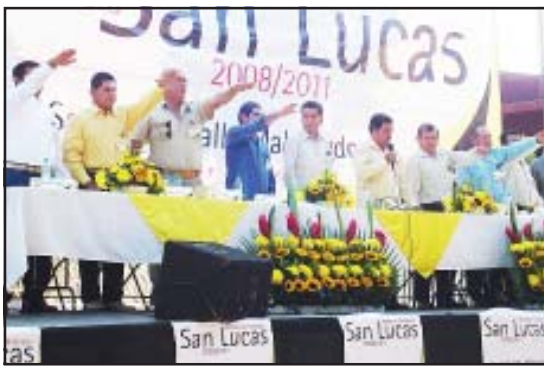
También Síndico y Regidores rindieron protesta en cumplimiento al ordenamiento de la Ley Orgánica Municipal de Michoacán.