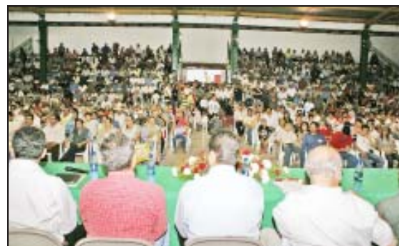
Varios cientos de personas de los diferentes sectores de la población del municipio de Carácuaro, asistieron al acto ceremonial de la toma de posesión del nuevo gobierno municipal que preside Román Nava Ortiz.