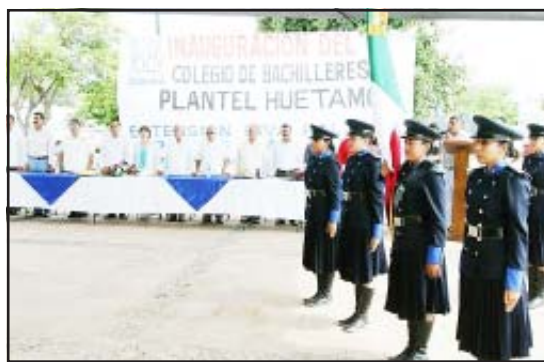
Con 65 alumnos el plantel Colegio de Bachilleres inicia sus labores escolares.