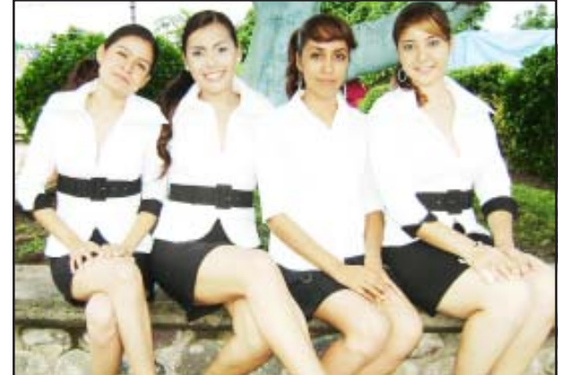
Un saludo para las bellas integrantes de la escolta del IMCED extensión Huetamo.

Hablando de chavos chambeadores, Beto Magaña, anda al cien, echándole todos los kilos en sus