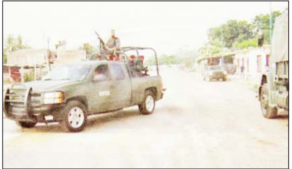
Las Fuerzas Armadas pretenden inhibir los delitos en la cabecera municipal de Huetamo y en todas sus comunidades a través de patrullajes de vigilancia para el resguardo de la seguridad, tranquilidad y paz social de los huetamenses.

Mientras tanto, la noticia de la llegada de fuerzas militares a la ciudad causaba sorpresa y asombro, pero también alegría, dado que la psicosis colectiva que prevalece en el Estado desde la noche del 15-S no termina, sin embargo concluyó con tranquilidad el cierre de las fiestas septembrinas con varios eventos populares, entre ellos un concurso de caballos bailadores, un jaripeo, un concurso de bandas de guerra y la quema de un espectacular castillo pirotécnico.