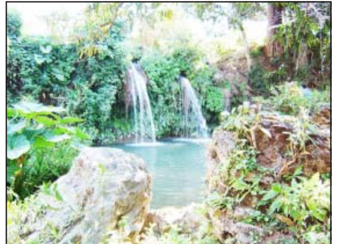
Bella Cascada de Quenchendio.

rio y en su interior se aprecia los hornos del trapiche donde se procesaba la caña de azúcar que se cultivaba en toda esta zona y más adentro estaba la gran casona de admirable belleza.