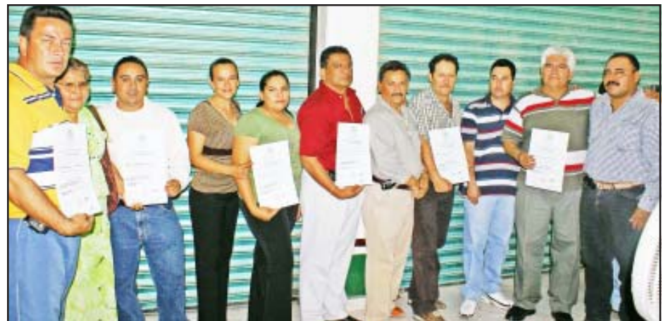
Los regidores priístas posaron para la foto del recuerdo una vez que recibieron sus Constancias de Mayoría de Votos.

La entrega de tan importante documento se efectuó el pasado martes en las ofici-