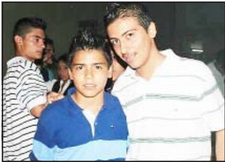
Escuadra y Pepe.

Hola a toda la raza perrona que nos acompaña en este nuevo mes de diciembre, nos da un gran placer estar de nuevo con ustedes este domingo, para compartir todos los chismes, noticias, eventos sobresalientes que han ocurrido y están próximas a ocurrir.