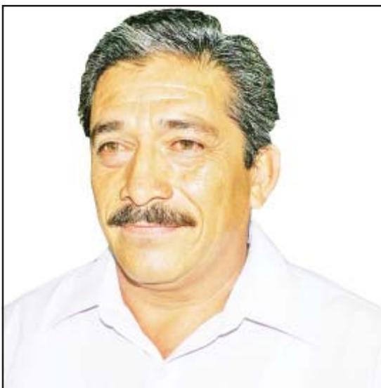
Jorge Granados García, presidente municipal de Huetamo, rinde este miércoles su Informe de Gobierno al frente del ayuntamiento de Huetamo.

En cumplimiento a lo dispuesto en la Ley Orgánica Municipal, el presidente municipal de Huetamo, Jorge Granados García, rendirá el tercer y último informe de la actual administración en su carácter de presidente municipal interino del municipio de Huetamo.