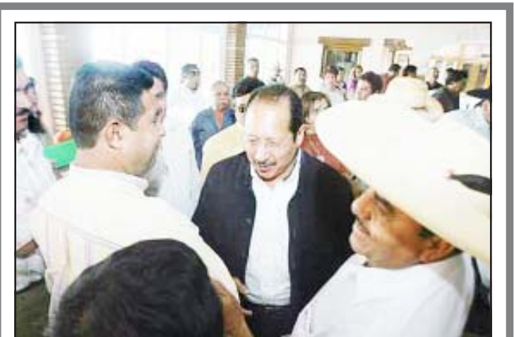
El gobernador electo, Leonel Godoy Rangel, se reunió con los 40 alcaldes electos emanados del sol azteca, entre ellos el presidente municipal electo de San Lucas, Servando Valle Maldonado, quien aparece en el extremo derecho de la foto.

ja o limón que contienen vitamina C, asimismo tomar medicamentos antigripales cuando empiecen los primeros síntomas, dijeron.