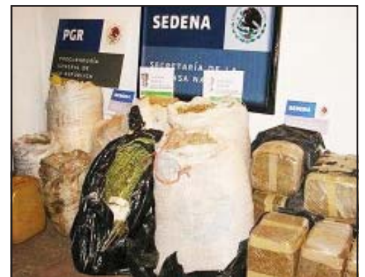
En una de las orillas de la brecha que conduce a San Antonio de Las Huertas, municipio de Carácuaro, fueron localizados por elementos policíacos marihuana y semilla de la misma hierba.

Por tal motivo, la droga quedó a disposición del representante social de la federación en Morelia, quien integra la indagatoria correspondiente, en contra de quien o quienes resulten responsables por la comisión del delito antes citado.