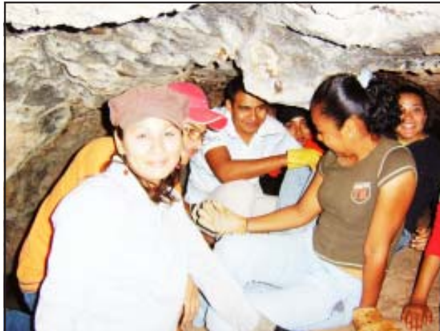
Cueva La Garrucha.

Quenchendio posee las mejores tierras de la región y el agua se encuentra casi a flor de tierra y por eso siempre fue codiciada por los más ricos de la zona, y pertenecía antiguamente al prefecto de Huetamo en la época de la revolución, a terratenientes y actualmente es una comunidad. La antigua exhacienda de este lugar se encontraba en el lugar que hoy se encuentra el balnea-