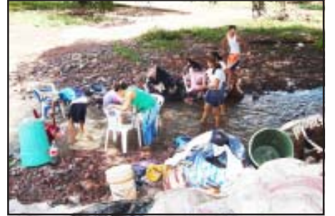
Calificada como una tromba por la fuerza e intensidad de lluvia caída sobre las viviendas de la tenencia de El Limón de Papatzindán, municipio de Tiquicheo, que a decenas de ellas las derrumbó y muchas más quedaron dañadas en su estructura, familias enteras quedaron sin hogar y muchas más sus muebles quedaron destruidos o dañados totalmente, obligando a la gente a vivir a la intemperie mientras llegaba el auxilio de las autoridades municipales y estatales.