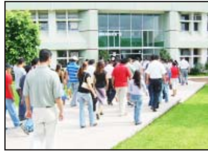
Con gran entusiasmo los alumnos entraron a su centro de estudios para después participar en la ceremonia de inicio de labores escolares del ciclo 2007-2008.