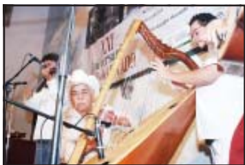
El grupo musical “Los Caporales”, interpretaron varias melodías de la música tradicional mexicana.