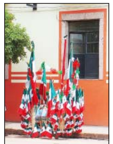
Ha comenzado la venta de banderas con los colores tricolores de la Enseña Nacional.