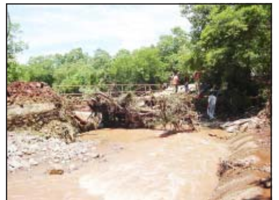
El agua arrastró todo lo que encontró a su paso.

Por su parte, la Secretaría de Salud implementó acciones para la prevención de brotes de enfermedades diarreicas y evitar brotes de dengue y paludismo, por medio de una brigada en la zona afectada, así mismo comenzarán con un caleo en la zona afectada, un punto importante es el saneamiento de la red y pozos de agua potable, para evitar la contaminación de los hogares por el cólera y diversas enfermedades.