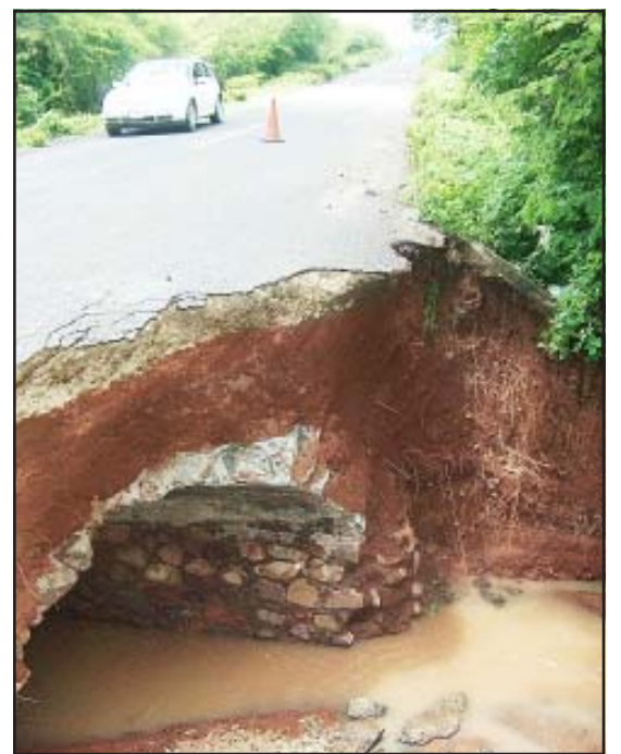
La carretera Tzitzio-Tamazcal-Morelia quedó seriamente dañada.

En el recorrido que realizaron a cada una de las viviendas afectadas, los funcionarios estatales se compro-