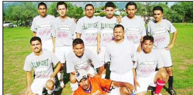
El equipo de La Parota, aún no puede dar el salto en el Torneo de Barrios 2007; si no comienzan a apretar fuerte en el cierre de la competición, dirán adiós a su participación.

En busca del pase a la etapa nacional de la Copa telmex, el equipo femenino de fútbol de Michoacán, empató a un gol con su similar del estado de Guerrero, el día de ayer, no alcanzándole dicho marcador, ya que en el resultado global perdieron las nuestras por 3 goles por 2.