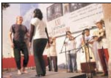
Sones y gustos fueron amenizados para que bailarines hicieran gala de su destreza sobre una tarima.