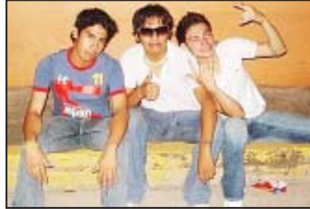
Andru, DVD y Kobe.

días anduvo secuestrando varios carros de sus amigos y por ahí comentan que ya lo andaban buscando hasta los tecolotes para rescatar dichos vehículos, pero sin poca y sin más vergüenza después de que los regresó, al irse del carro no se fue con las manos vacías, pues se rumora que hasta discos les robó a sus cuates, le decimos a este chavo que aparentemente anda muy jodidillo, que se ponga las pilas, porque no nos gustaría seguir quemándolo en nuestra sección de rostizadas, o bien si tantas ganas tiene de CD's que venga a nuestras oficinas y aquí le vamos a regalar una torre para ver si así se llena y de paso su dotación de galletas de animalito.