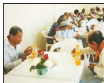
Un gran convivio les fue ofrecido a las personas de la tercera edad en San Lucas, con motivo del Día del Anciano que les fue ofrecido por el DIF municipal.