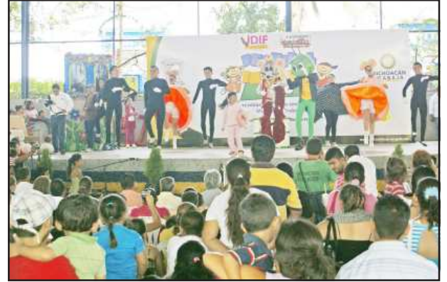
El show infantil "Estampas de Cri-Crí", el reparto de juguetes, agua refrescante y algunos bocadillos, les fue ofrecido a las niñas y niños huetamenses durante el "Festival Infantil 2010", que el DIF Estatal les ofreció en esta ciudad con motivo del Día del Niño.