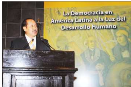
La participación ciudadana en las decisiones del gobierno debe ser la base para lograr efecto de los mayores problemas que hoy enfrenta México, la pobreza, dijo el gobernador Leonel Godoy, durante el séptimo foro "Gobernabilidad y desarrollo democrático; la democracia en América Latina".

Es indispensable, subrayó, que las personas puedan ejercer sus derechos económicos, sociales y culturales, es decir que tengan la seguridad de un trabajo bien remunerado, acceso al bienestar que incluye alimentación, vivienda, vestido, salud, educación y esparcimiento.