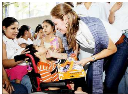
La presidenta del Sistema DIF Estatal Magdalena Ojeda Arana, personalmente hizo entrega de juguetes a niños con capacidades diferentes que asistieron al festival.

Posteriormente, Ojeda Arana, hizo entrega de juguetes para los menores de escasos recursos y que difícilmente tienen acceso a un buen regalo con motivo del Día del Niño; cumpliendo