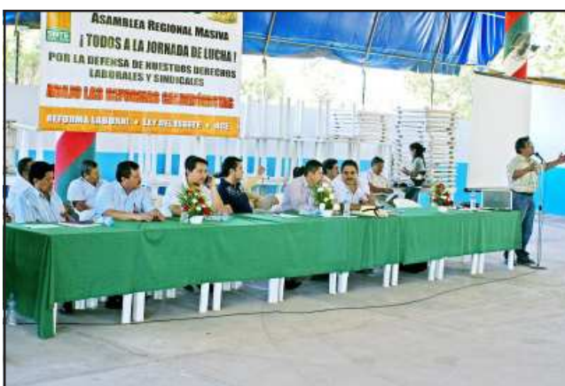
Dirigentes sindicales presidieron la asamblea.