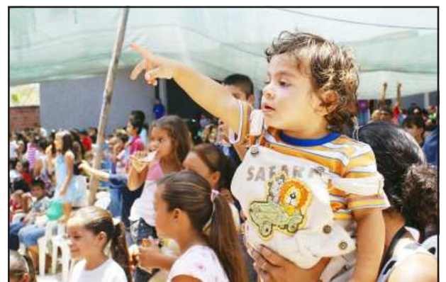
Todos los niños y las niñas recibieron sus regalos, pero hubo uno muy pequeño que decía: "yo quiero otro", que su mamá levantaba en todo lo alto.