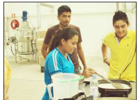
En pequeño mostraron sus aprendizajes quienes recibieron capacitación en la elaboración agroalimentaria para su transformación y posterior comercialización.

Con este tipo de obras el presidente Nava Ortiz, demuestra el interés que tiene por sacar adelante a su municipio y beneficiar de alguna u otra forma a todos los habitantes de Carácuaro, ya que actualmente el 95% del territorio caracuarenses