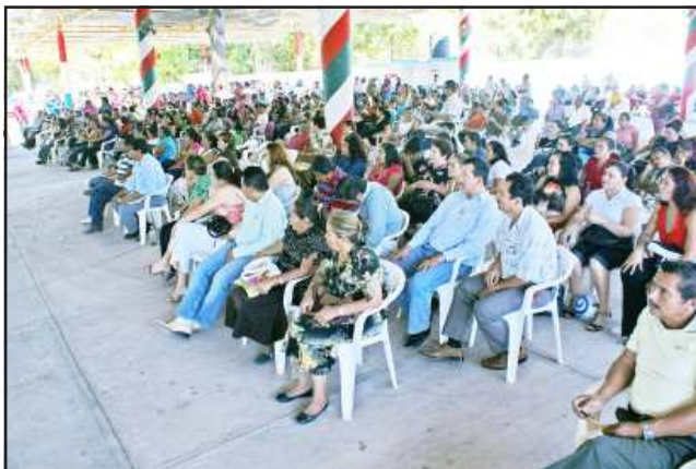
Centenares de maestros asistieron a la asamblea regional.